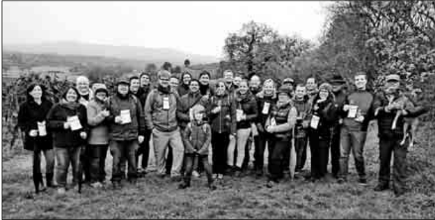
Die Helfer und Helferinnen der Musik- und Feuerwehrkapelle Teningen in den Weinbergen von Köndringen.

In diesem Rahmen möchte sich die Musik- und Feuerwehrkapelle nochmals bei allen bedanken, die zur erfolgreichen Durchführung am Teninger Gassenfest beigetragen haben.