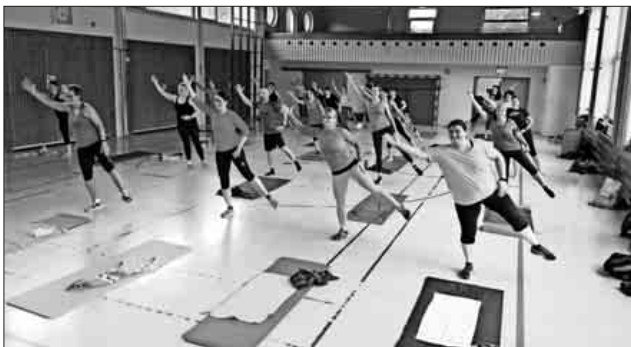
Fitness Convention Heimbach 2018

Auch in diesem Jahr waren die zahlreich erschienenen Teilnehmer sehr motiviert und viel Spaß gehabt ... es war eine tolle Stimmung und der TBV freut sich schon jetzt auf die fünfte Convention, die im nächsten Jahr folgen wird! Ein herzliches Dankeschön an alle Teilnehmerinnen und Teilnehmer und an alle helfenden Hände!