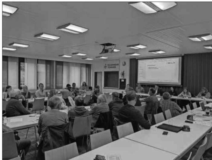
Vertreterinnen und Vertreter der Vereine trafen sich mit der Gemeindeverwaltung, um den Veranstaltungskalender für das Jahr 2026 aufzustellen.

Auch das Sommerprogramm für Senioren wurde im Rahmen des Treffens gelobt. Im Jahr 2024 seien acht Vereine beteiligt gewesen, so Seniorenbeauftragte Gabi Bürklin. Sie selbst habe die Rückmeldung erhalten, dass das Programm gut aufgenommen worden war. Interessierte Vereine können sich noch bis Anfang Juni mit Veranstaltungen für das diesjährige Sommerprogramm anmelden.