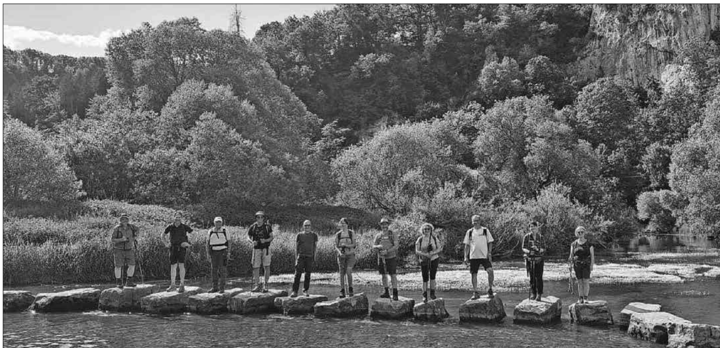
Die Wandergruppe auf den Trittsteinen bei der Jägerhütte.

eine Landschaft wie aus dem Modelleisenbahnbastelbuch. Konnten die Wanderer den Schweiß des ersten Tages noch im Pool- und Wellnessbereich des Berghauses Knopfmacher abwaschen, erledigte dies am zweiten Tag das plötzlich aufziehende Gewitter auf dem letzten Wanderkilometer vor den rettenden Autos in Beuron. Ob es Glück oder der direkte Draht zu Petrus aufgrund der nahen Erzabtei Beuron war, bleibt ungeklärt. Jedenfalls konnten sich die Wanderer kurz darauf bei Sonnenschein wieder trockenlegen. Somit war das einhellige Fazit – toll war's!