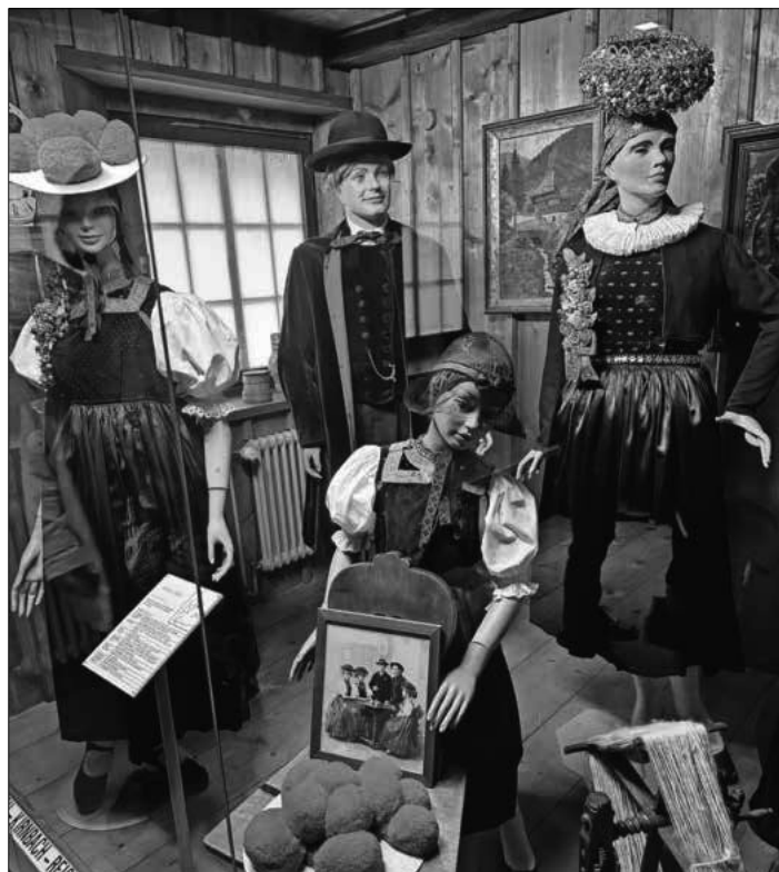
Im Haslacher Trachtenmuseum.

Die Fahrt ging durch das Elztal in das hübsche Fachwerkstädtchen Haslach im Kinzigtal . Unterwegs erfuhr man Interessantes über das Kapuziner-Kloster und das Leben der Mönche, die sich seit circa 1530 in der Krankenpflege und Seelsorge verdient gemacht haben, so zum Beispiel mit Wallfahrten zum heiligen Hörnleberg bei Oberwinden. Das Kloster liegt in einem wunderschönen Park mit bunten Blumen und riesigen Bäumen, ist denkmalgerecht und barrierefrei restauriert und birgt außerdem das Trachtenmuseum . In den ehemaligen Klosterzellen gab es Schwarzwälder Trachten aus verschiedenen Ortschaften zu bestaunen. Die feinen Stickereien fanden große Bewunderung. Auch die Bollenhüte durften nicht fehlen. Die Kleidung mit Rot war zum Tanzen, aus vornehmem Schwarz für den Kirchgang bestimmt, und der bis zu drei Kilogramm schwere Schäffel für Hochzeiten. Nach einem kurzen Spaziergang durch die historische Altstadt und einem Cafébesuch erfuhren die Teilnehmerinnen und -teilnehmer auf der Rückfahrt durch enge Schwarzwaldtäler noch Interessantes über den berühmten Haslacher Pfarrer und Dichter Heinrich Hansjakob .