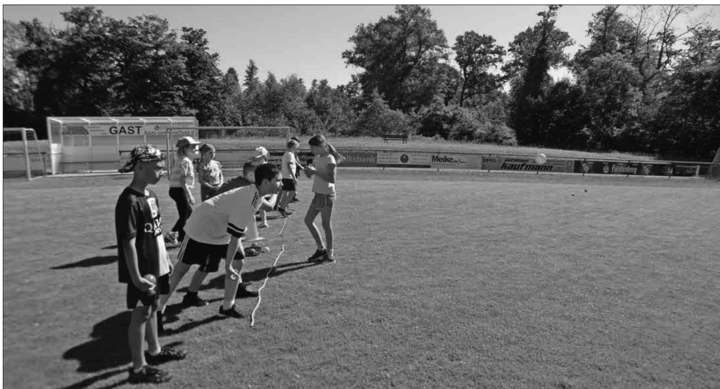
Die Kinder beim Sport- und Spielefest der Antoniter-Grundschule.