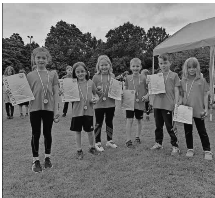
Das Teningen Team des TuS Teningen.

Sportabzeichentraining und Abnahme: Mittwoch ab 18.30 Uhr im Emil-Schindler-Stadion.