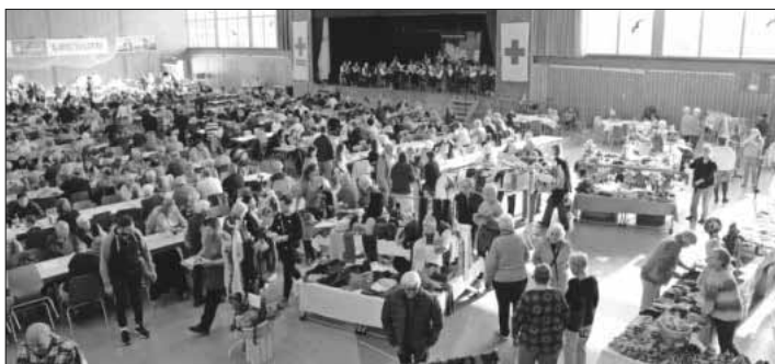
Der diesjährige Wohltätigkeitsbasar in der Ludwig-Jahn-Halle war sehr gut besucht.