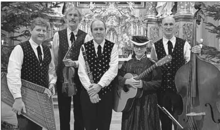
Instrumentalbesetzung: Zither, Violine, Klarinette, Gitarre und Kontrabass.

Im Anschluss an das Konzert wird es einen gemütlichen Ausklang im Gemeindehaus geben mit Glühwein und Gebäck.