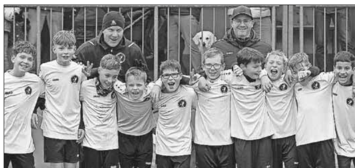
Jubel bei den D2-Junioren über das tolle Ergebnis.

JfV Untere Elz will Spieler ins Team: Wer hat Lust auf Fußball? Wer wollte schon immer mal in einem tollen Team spielen? Wer macht momentan eine Pause, will nun aber wieder einsteigen? Dann einfach zum JfV kommen. Alle Infos gibt es unter info@jfv-untere-elz.de .