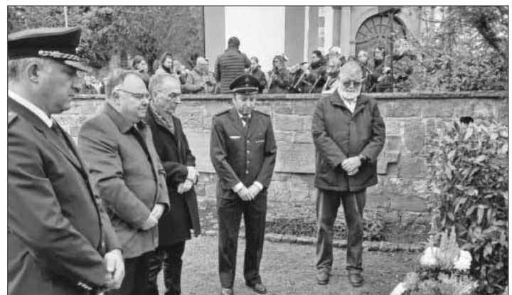
Die Kranzniederlegung am Mahnmal wurde musikalisch vom Männerchor und dem Musikverein Heimbach umrahmt.

Der eigentliche Sinn des Tages sei, auch auf die Brüchigkeit von Demokratie und Frieden aufmerksam zu machen, die man gerade heute auch wieder stärker spüre, so der Bürgermeister. Außerdem wandte er sich mit einem konkreten Appell an die Anwesenden: „Wir müssen unsere Stimme erheben, wenn Rassismus und Hass wieder um sich greifen“, so Hagenacker. Dabei solle man das mahnende Andenken der Verstorbenen der beiden Weltkriege bewahren.