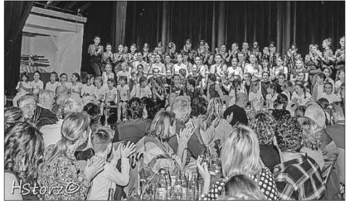
Die Turnerinnen und Turner beim diesjährigen Gala-Abend des TV Köndringen.