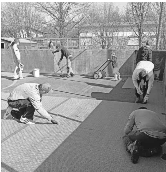
Platzputz bei den Nimburg Crocodiles. Zahlreiche Helfer des Vereins kümmern sich bei bestem Wetter um die Instandhaltung des Platzes.

Ab sofort können wieder Kinder zwischen 5 und 9 Jahren bei den Crocodiles das Inline-Skaten und Inlinehockey-Spielen lernen. Sowohl Fahranfänger als auch Kinder mit erster Erfahrung auf den Skates sind herzlich willkommen. Der SHC freut sich über zahlreiche neue Gesichter! Infos unter www.nimburg-crocodiles.de .