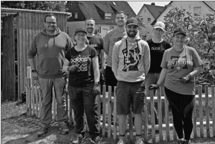
Ein Teil der anwesenden Elternschaft und Elternbeirat vor dem neu angelegten Gartenbereich.

Mit Unterstützung einiger Eltern hat der Elternbeirat des Kindergartens Villa Kunterbunt in Teningen am vergangenen Samstag wieder eine Gartenaktion durchgeführt. Die Kinder können sich über einen sauberen Außenbereich, einen neuen Gartenbereich mit Hochbeeten und neue Spielmöglichkeiten freuen. Auch für das leibliche Wohl wurde gesorgt. Vielen Dank an die anwesenden Eltern und VK-Team für die Unterstützung.