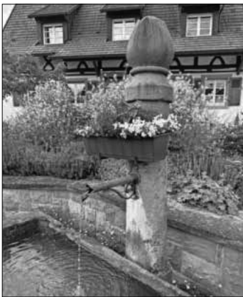
Brunnen in der Habsburgerstraße.

Die Heimbacher Brunnen sind wichtiger Bestandteil des Dorfes. In den 1850er Jahren wurden sie errichtet, vermutlich von der Gemeinde als Arbeitsbeschaffungsmaßnahme. Damals waren Jahre mit schlechter Ernte, Hungersnot und - dadurch bedingt - sogar Auswanderung. Es sind fünf Langbrunnen, davon drei in der Dreibrunnenstraße und ein Rundbrunnen in der Friedhofstraße für die Küferei. Alle bestehen aus einem Tränketrog für das Vieh und einem kleineren Putztrog. Der imposanteste Brunnen steht gegenüber vom ehemaligen Gasthaus Sternen.