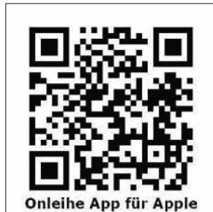
Onleihe App für Apple

Wer sich mit den Onlinefunktionen noch nicht auskennt, ist eingeladen, vor Pfingsten einen individuellen Termin zu vereinbaren, um sich diese zeigen zu lassen. Möglich sind Termine Dienstag bis Freitag, jeweils um 17 Uhr. Es wird gebeten, sich per E-Mail anzumelden: mediathek@teningen.de .