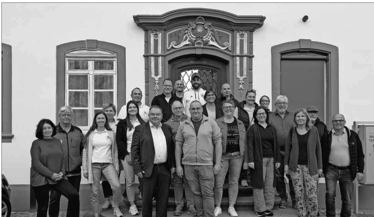
Die Vereine und die Gemeindeverwaltung trafen sich zur Planung.

Auch für die Kleinsten gibt es Einiges zu sehen: Die Evangelischen Kindergärten bieten einen Infostand mit Kinderbeschäftigung. Die Kita Dreikäsehoch bietet Muffins, Sommerschorle und ein kreatives Kinderangebot. Die FCT-Jugend verkauft Waffeln und bietet die Möglichkeit, sich selbst am Ball zu probieren.