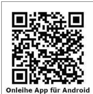
Onleihe App für Android

Voraussetzung zur Nutzung ist ein Internetzugang sowie eines der folgenden Endgeräte: PC, E-Reader, Tablet oder Smartphone. Für Smartphones und Tablets kann die App „Onleihe“ genutzt werden.