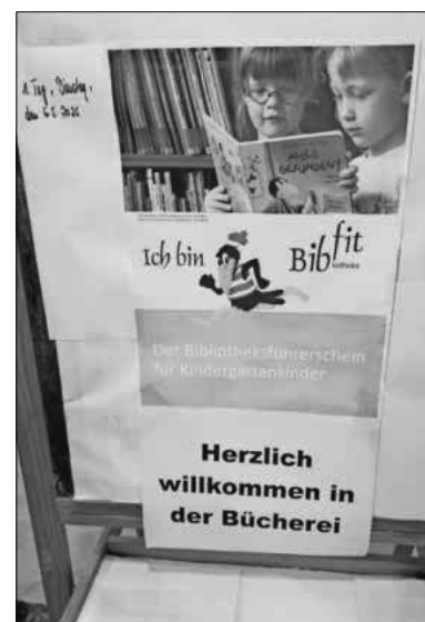
Herzliche Begrüßung der Schulanfänger in der Bücherei in Heimbach.