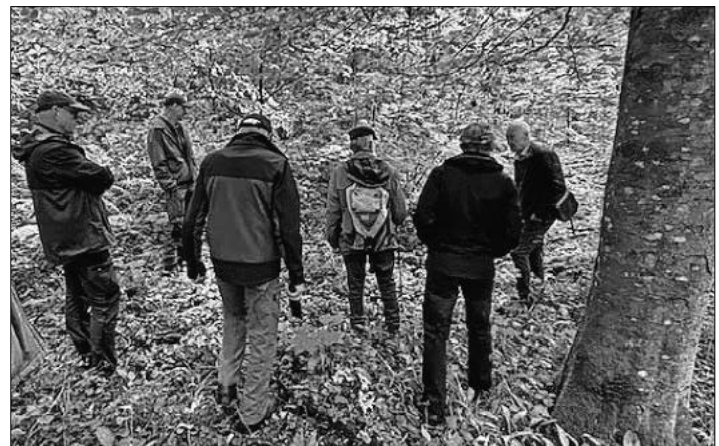
„Mittendrin“ im Wald.