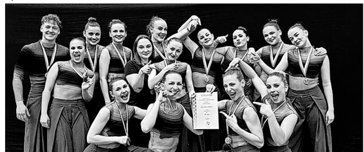
Die Formation onda dance company nach ihrem Turniersieg in der Regionalliga Süd.

Am Wochenende startete die Turniersaison im Jazz und Modern Contemporary Dance für alle vier Turnier-Mannschaften des Tanzsportclubs Teningen. Den Auftakt machte am Samstag die onda dance company in Herrenberg. In der Regionalliga Süd überzeugte das Team mit einem hochklassigen Durchgang und zog souverän in das große Finale ein. Dort sicherte sich die Mannschaft mit der bestmöglichen Wertung von 1 – 1 – 1 – 1 – 1 den Turniersieg. An diesen Erfolg knüpften die drei weiteren Mannschaften des Vereins an. Am Sonntag ertanzte sich die Oberliga-Formation flux dance company nach zwei starken Runden im bayerischen Michelau den dritten Platz und damit die Bronzemedaille. Auch für die Formationen connect und joukko, die in der Kinder- und Jugendverbandsliga Süd an den Start gingen, verlief der Saisonauftakt äußerst erfolgreich. Während connect die Wertungsrichter überzeugte und in der Kinderliga den ersten Platz belegte, sicherte sich joukko in der Jugendliga mit der Spitzenwertung 1 – 1 – 1 – 1 – 1 ebenfalls den Turniersieg und damit die Goldmedaille. Die erstklassige Arbeit der Mannschaften wurde belohnt – entsprechend motiviert blicken sie auf ihre nächsten Turniere.