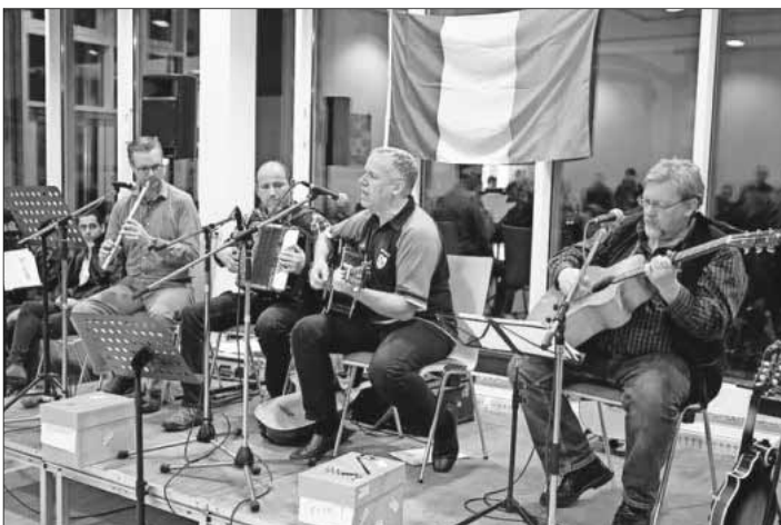
Die Band „Last Order“.