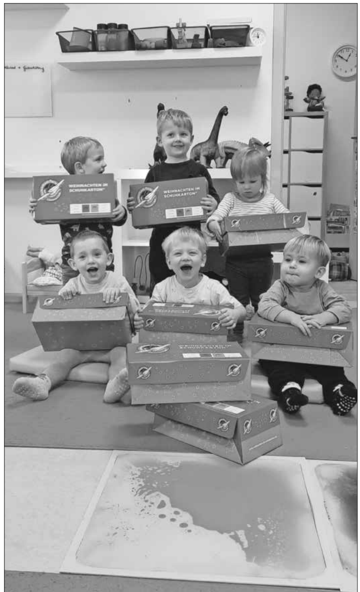
Einige Kinder der Kita Dreikäsehoch.