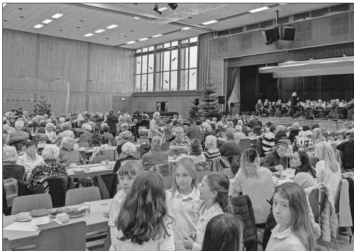
Das Publikum in der Ludwig-Jahn-Halle war zum Mitsingen und Mitklatschen eingeladen – und kam der Aufforderung auch gerne nach.