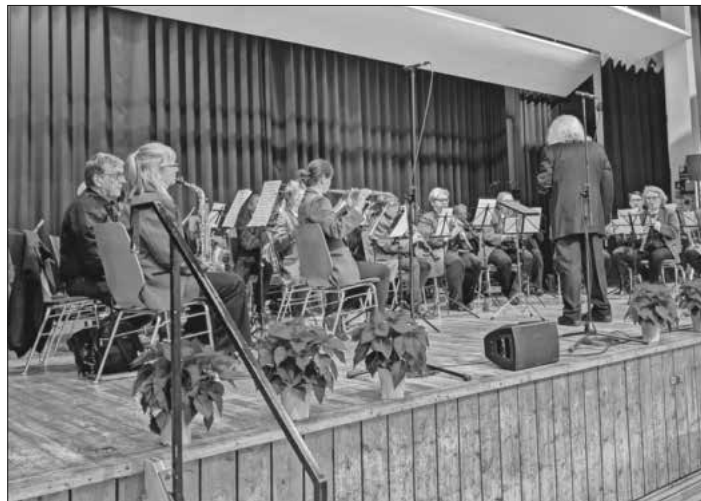
Der Musikverein Nimburg-Bottingen spielte beim Seniorennachmittag.