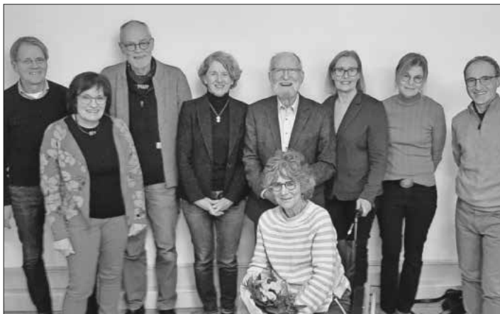
Vorstand und Beirat des Kulturvereins.