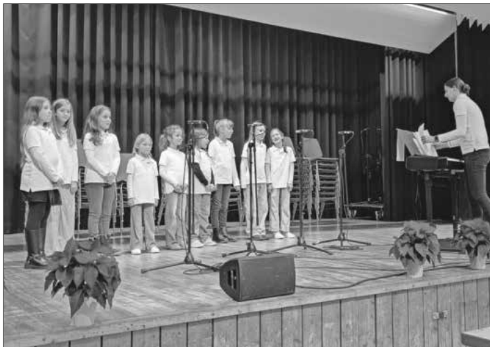
Stolz auf ihre Performance waren die Kinder des Kinderchors.