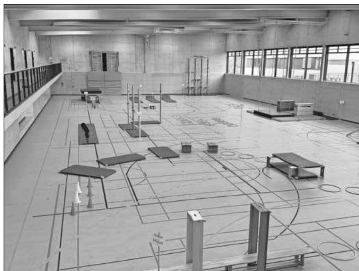
Aufbau der 10 Übungslandschaften vor dem Ansturm.

Der Turnverein zeigte sich sehr zufrieden mit der Resonanz und freute sich über die vielen motivierten jungen Sportlerinnen und Sportler, die die Premiere der Kinder-Winterolympiade zu einem vollen Erfolg machten.