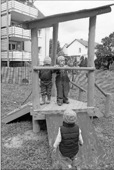
Der neue Spielturm

einem Gurtband als Rutsche unterschiedlich gestaltet, wodurch die Kinder in ihrer Bewegungsentwicklung optimal gefördert werden.