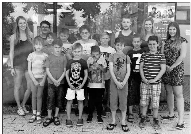
Die Teilnehmer der Sommeraktion.