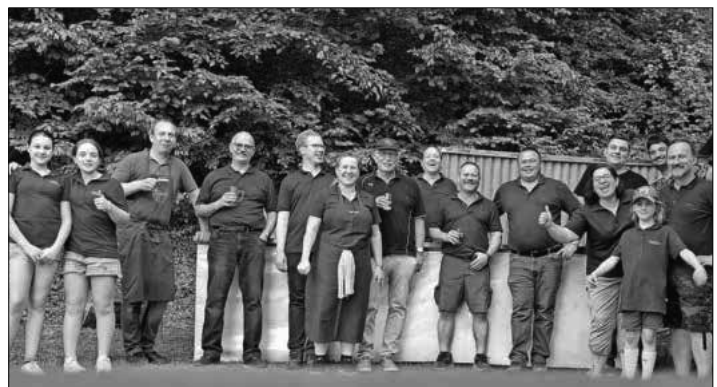
Das Organisationsteam des Sportschützenverein Köndringen.