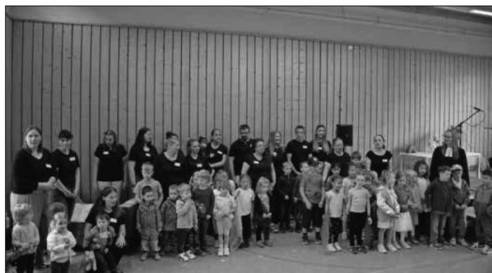
Die Kindergartenkinder beim Festgottesdienst.