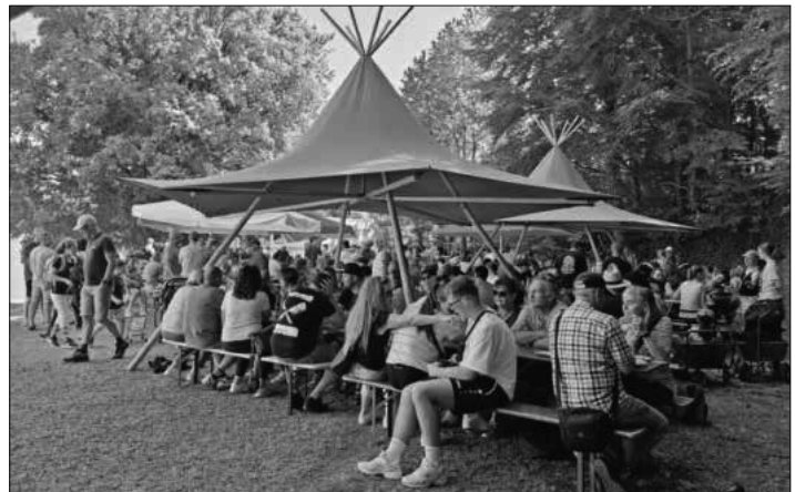
Der 1.-Mai-Hock war sehr gut besucht.

18. und 19. Juli: Dorfmeisterschaften der örtlichen Vereine und Firmen sowie Stammtischmannschaften. Infos zeitnah unter www.ssv-koendringen.info .