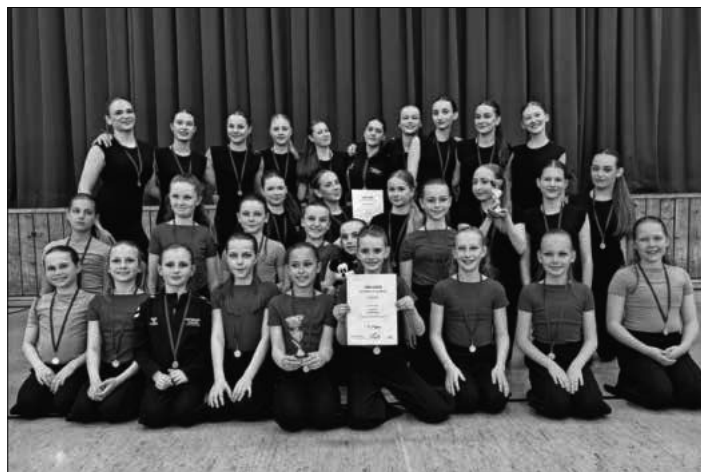
Zwei Pokale für Joukko und Connect.