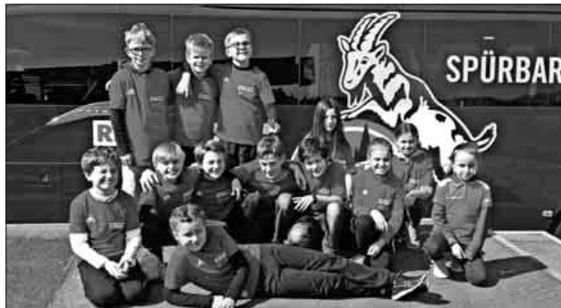
Die TCT-Kids vor dem Mannschaftsbus der Gäste aus Köln.

Am vergangenen Sonntag durften 13 TCT-Mannschaftsspieler zwischen neun und elf Jahren beim Fußballspiel der Frauen des SC Freiburg gegen den 1. FC Köln als Einlaufkinder in der 1. Bundesliga mitmachen. Das Losglück entschied, dass die Teninger Kinder mit der Heimmannschaft Hand in Hand einlaufen konnten. Für die Kids war dies eine spannende Sache und alle waren sehr aufgeregt. Bei Sonnenschein und unter anfeuernden Rufen der Teninger Jugend gewann der SC souverän mit 6:0. Nach dem Spiel hatten die TCT-Kids noch die Möglichkeit, auf dem Spielfeld das ein oder andere Bild mit einer SC-Spielerin zu machen und es wurden auch kräftig Autogramme gesammelt. Alle Kinder waren zufrieden. Es war ein rundum gelungener Ausflug, der die Mannschaftsspieler noch weiter zusammenschweißte.