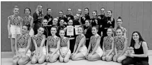
Große Freude bei den Tänzerinnen der Turniergruppen „Joukko“ und „Jazz à Nova“. „Jazz à Nova“ mit Pokal und Medaillen für den 3. Platz.

war dies ein verdienter sechster Platz von acht Gruppen. Dies war umso schöner, da sich eine Tänzerin unglücklicherweise beim ersten Tanz verletzt hatte und dann nicht mehr starten konnte. Damit gab Joukko verdient auch die „rote Laterne“ ab und steht nun auf Platz 7 der Tabelle. Einen Tag zuvor war die Turniergruppe Effekt in der Regionalliga Süd, der dritthöchsten Liga, angetreten. Leider schaffte sie es diesmal nur bis ins kleine Finale. Dort konnte sie sich steigern und die Wertungsrichter überzeugen. Souverän konnte sie das kleine Finale für sich entscheiden und die anderen Gruppen hinter sich lassen. Am Ende wurde sie Siebte von elf Gruppen. Dies ergibt in der Tabelle ebenfalls Platz 7.