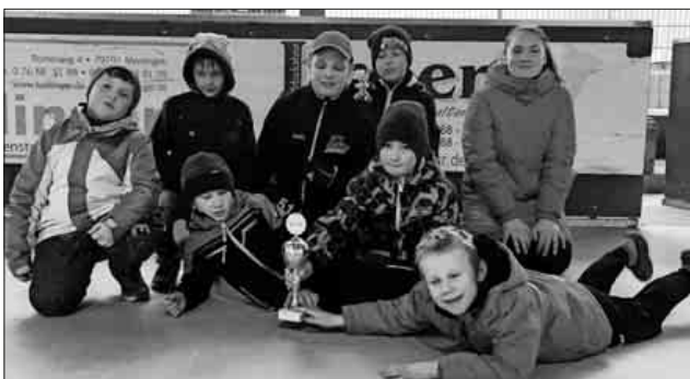
Schülermannschaft Spielgemeinschaft Nimburg – Sasbach.

Die ersten Heimspiele in Nimburg finden am 1. Mai ab 11.30 Uhr statt. Alle Spieltermine der Saison sind unter www.nimburg-crocodiles.de abrufbar. Nachwuchstraining findet immer montags und donnerstags um 18 Uhr am Nimburger Inlinehockeyplatz statt.