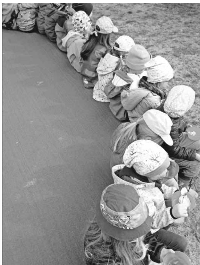
Eis schlecken in der Frühlingssonne.