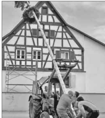
Mit vereinten Kräften wird der Maibaum an seinen Platz gestellt.

In der Nacht der Hexen, dem 30. April, der sogenannten Walpurgisnacht, stellten die Nimburger Felse-Trieber wieder den traditionellen Maibaum in der Nimburger Ortsmitte. Nach dem der Baum an seinem Platz aufgestellt war, wurden acht neue Hexen getauft und ihnen symbolisch der Holzstock für ihren ersten Hexenbesen übergeben. Im Anschluss wurde zu Ehren der Nacht der Hexen gemeinsam mit allen großen und kleinen Hexen und Teufeln in den Mai hineingefeiert.