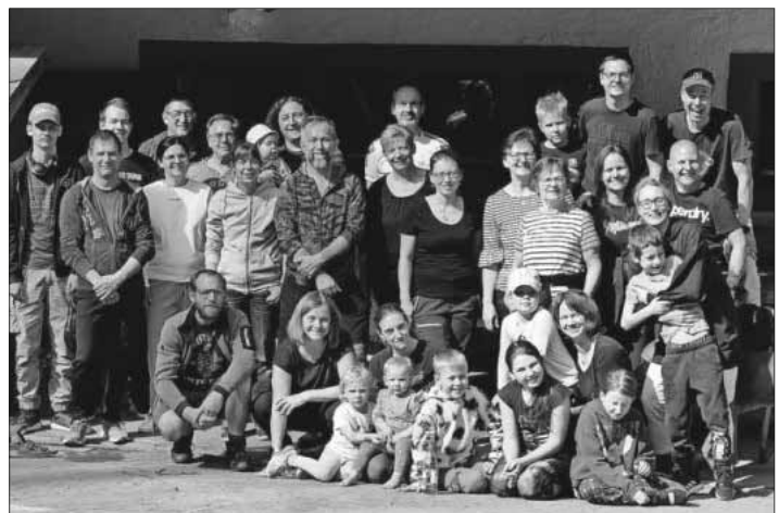
Der Fanfarenzug Teningen auf dem Ibichhof.

Vom 12. bis 14. April, fand nach einer langen Corona-Pause endlich wieder das Hüttenwochenende des Fanfarenzugs auf dem Ibichhof in Simonswald statt. Bereits am Freitagmittag brachen die Mitglieder und ihre Begleitungen voller Vorfreude vom Rathausplatz auf, um das idyllische Ambiente der Hütte bei bestem Wetter zu erleben. Ein gemütliches Lagerfeuer mit Stockbrot und Marshmallows bildete hierbei den perfekten Abschluss des Tages. Am Samstag setzte sich das Programm mit einer gemeinsamen Wanderung, der obligatorischen Musikprobe, gefolgt von einem geselligen Abendessen fort. Natürlich wurde anschließend, beim abendlichen Lagerfeuer, noch ein kleines bisschen gefeiert. Nach einem stimmungsvollen Wochenende traten die Teilnehmer am Sonntagmorgen nach dem Frühstück gut gelaunt die Heimreise an.