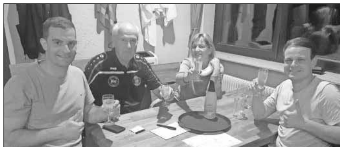
Das Gewinnerteam „Alte Herren“.