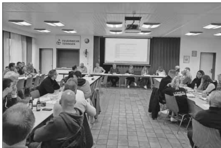
Viele Vereine nahmen an der Besprechung des Veranstaltungskalenders 2025 teil.

Die Feuerwehr Nimburg lädt am 20. und 21. September zum beliebten Zwiebelkuchenfest. Das Herbstfest der Feuerwehrabteilung Köndringen findet am 11. und 12. Oktober statt, am Wochenende darauf geht es in Heimbach hoch her: vom 18. bis 20. Oktober ist Kilwi. Der Wohltätigkeitsbasar des DRK findet auch dieses Jahr am 1. November in der Jahn-Halle statt. Am 28. November ist Glühweinhock in der Nimberghalle. Der erste Advent (30. November) steht in der Jahn-Halle wieder im Zeichen des Seniorennachmittags. Im Dezember laden verschiedene Advents- und Weihnachtsmärkte in die Ortsteile und die Kerngemeinde: Am 6. Ist Adventsmarkt in Nimburg und Heimbach, für den Weihnachtsmarkt in Teningen ist das Wochenende um den 13. und 14. Dezember eingeplant. Ebenfalls am 14. findet das Adventssingen in Heimbach statt. Vom 27. bis 30. Dezember ist die Jahn-Halle ein letztes Mal belegt: An diesen Tagen findet der Jugend-Allmend-Cup statt.