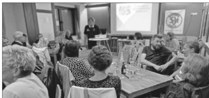
45 Quizbegeisterte aufgeteilt in zehn Teams, nahmen am zweiten Kneipenquiz teil.