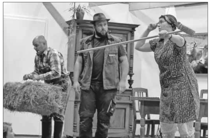
Bauer Hafner ertappt Magd und Knecht bei ihren Streitereien.

Die Laiendarsteller, überwiegend aktive Akkordeonspieler, verstanden es hervorragend, die unterschiedlichen Charaktere hervorzubringen, und spielten sich mit ihrer mitreißenden und erfrischenden Art in die Herzen des Publikums, das mehrfach spontanen Szenen- und einen langen Schlussapplaus gab.