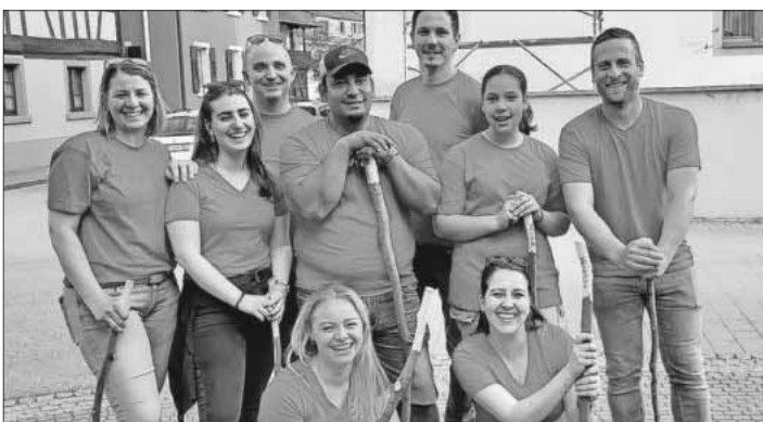
Die neuen Hexen mit dem ersten Vorstand (3. von links).