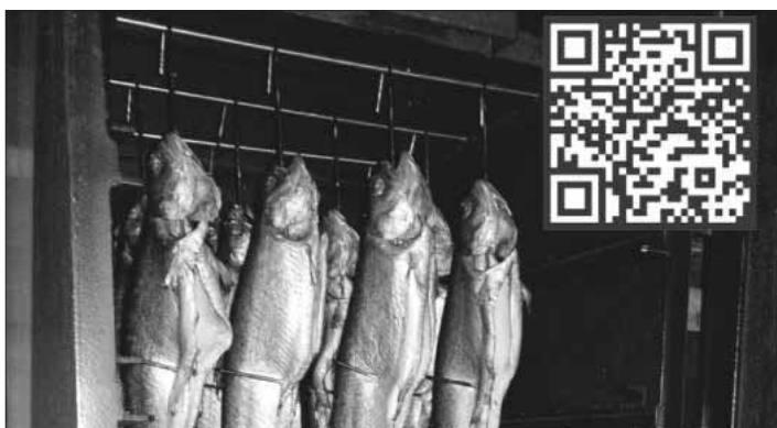
Der QR-Code führt zum Bestellformular.

Die Bestellungen sind dann am Sonntag, 12. Mai, zwischen 11 und 15 Uhr auf dem Vereinsgelände des ASV Teningen am Nimburger Baggersee abzuholen. Ein Kauf ohne Vorbestellung ist ebenfalls (bis 16 Uhr) möglich, jedoch nur solange der Vorrat reicht. Der ASV Teningen freut sich auf zahlreichen Besuch und über die Unterstützung und wünscht guten Appetit.