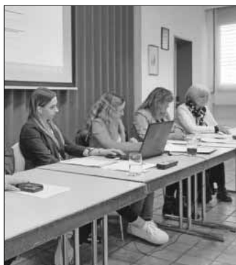
Die Termine wurden von Mitarbeiterinnen der Gemeinde Teningen vorgetragen.

Vom Dreikönigsturnier in der Jahnhalle bis zum Adventsmarkt auf dem Rathausplatz: Am vergangenen Mittwoch, 24. April, besprachen die Gemeinde Teningen und die Vorstände der Vereine den Veranstaltungskalender