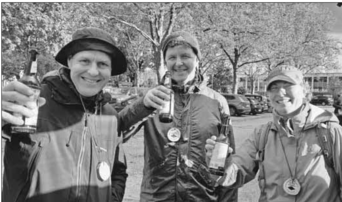
Nach neun Stunden und siebzehn Minuten kamen die ersten drei Teilnehmer nach 50,87 Kilometern ins Ziel.

Unter diesem Motto stand eine besondere Wanderung, die elf Mutige am 21. April in Angriff nahmen. Der Start war um 7 Uhr morgens an der Ludwig-Jahn-Halle. Es ging größtenteils auf dem Gemeindegebiet Richtung Nimburg, Bottingen, Reute zurück über die Allmend, dann über Mundingen, Heimbach, Malterdingen, Köndringen wieder zurück an die Ludwig-Jahn-Halle. Waren die Teilnehmer zu Beginn etwas angespannt, so besserte sich die Stimmung von Station zu Station. Dies lag auch an der guten Verpflegung mit Bananen, Riegeln, Linsensuppe, Schokokuchen usw. Dieser Tag hielt alles für die Wanderer bereit: Dauerregen, Schauer, Schneegehaupel und Sonnenschein. Eine Gruppe von drei Teilnehmern bildete sich schnell und diese kamen auch mit einer sehr sportlichen Gehzeit von neun Stunden 17 Minuten nach 50,87 Kilometern ins Ziel. Die zweite Gruppe kam mit dem letzten Sonnenlicht erschöpft, aber glücklich ins Ziel. Vier Personen stiegen nach der Marathondistanz in das Auto, aber auch diese Teilnehmer werden zu dieser Leistung beglückwünscht. Fazit des Tages: Es hat allen Beteiligten, auch den Helfern, viel Spaß gemacht und es wird eine Langdistanz in irgendeiner Weise wieder angeboten. Denn dies war Werbung für die schöne Gegend, den Wandersport und die Bewegung an der frischen Luft.