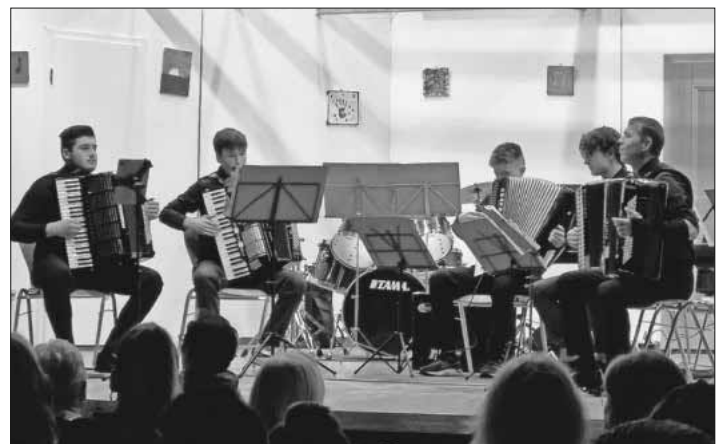
Flinke Finger beim phantastisch aufspielenden Ensemble.