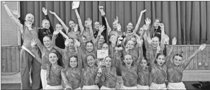
Die Teams des TSC Teningen.

Am 16. und 17. Mai fand im Jazz und Modern Contemporary Dance das Heimturnier des Tanzsportclub Teningen statt. Flux dance company starteten samstags in der Oberliga Süd, ernteten sich einen tollen dritten Platz und gewannen damit den Bronzepokal. Ebenso an diesem Tag ging die onda dance company in der Regionalliga Süd an den Start und konnte sich auch bei diesem dritten Turnier der Saison mit allen Einsen den eindeutigen ersten Platz sichern. Für beide Mannschaften wird das Abschlussturnier der Saison in drei Wochen stattfinden. Anders jedoch für connect und joukko, war es diesen Sonntag schon ihr letztes Turnier der Saison. Connect trat in der Kinderverbandsliga Süd an und gewann mit allen fünf Einsen nicht nur das Abschlussturnier, sondern landet auch in der Gesamttabelle auf Platz 1. Joukko konnte in der Jugendverbandsliga Süd ebenso überzeugen, auch sie gewannen und holten am Wochenende den Goldpokal. Das Team steht an der Spitze der Gesamttabelle und das sogar mit absoluter Bestleistung mit 15 von 15 möglichen Einser-Wertungen. „Der Ehrgeiz und der Fleiß dieser Mannschaft hat sich ausgezahlt. Wir blicken nun mit großer Vorfreude auf die nächste Challenge und haben Lust, erneut anzugreifen.“, kommentiert Trainerin Jana Pfeiffer das Ergebnis. Beide Mannschaften dürfen sich Baden-Württembergische Meister nennen und qualifizieren sich somit für die süddeutschen Meisterschaften, bei denen die begehrten Tickets für die Deutsche Meisterschaft gelöst werden.