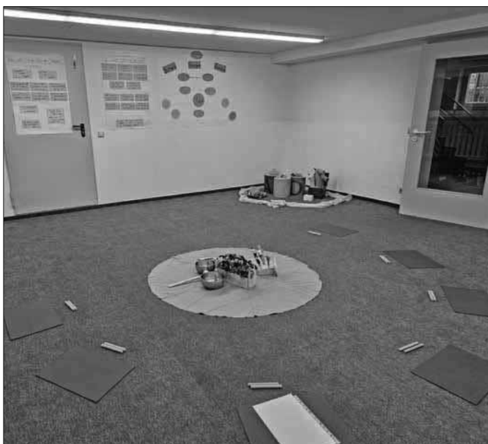
Workshop zu „Singen-Bewegen-Sprechen“ (SBS).