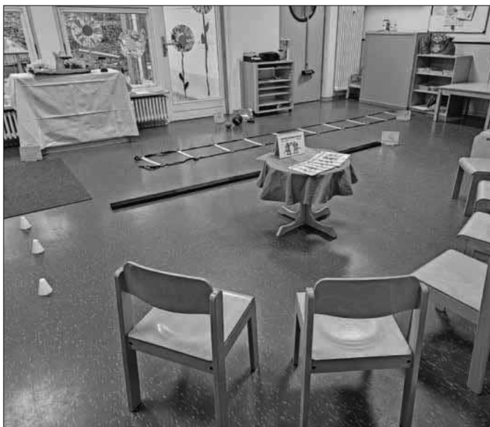
Workshop zu „Bewegungspass BW“.