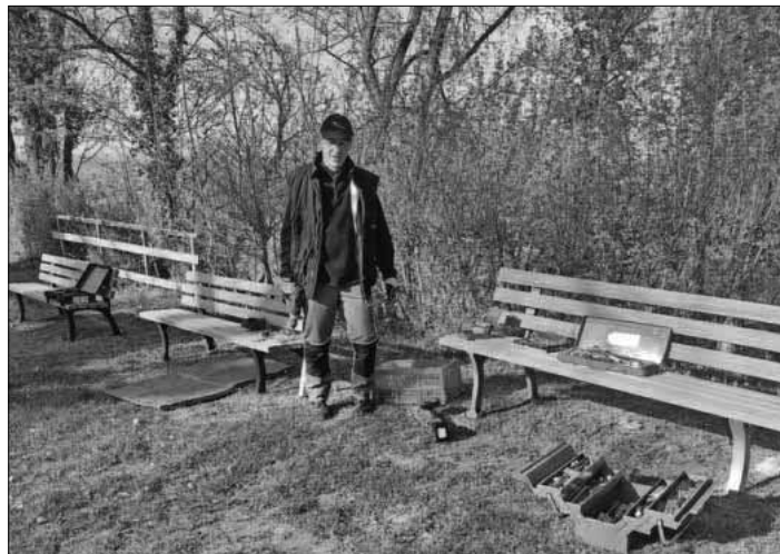
Die sanierten Parkbänke.