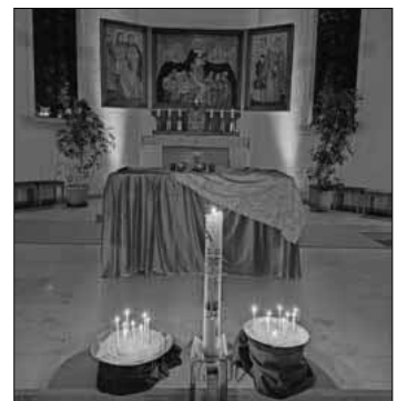
Bei der „Nacht in der Kirche“ erhellte der Kirchenraum in blauem Licht und Kerzenschein.