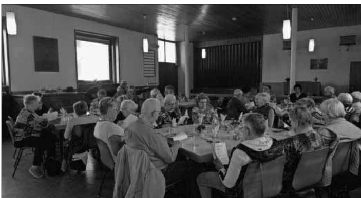
Der Gemeindemittag war gut besucht.