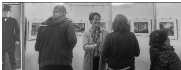
Die Eröffnung der Ausstellung war ein voller Erfolg.