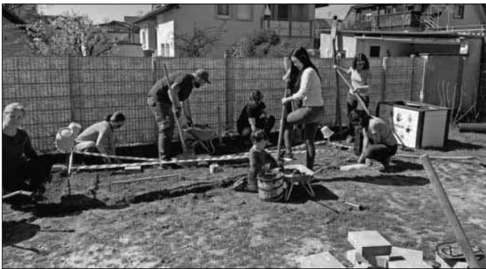
Viele engagierte Eltern halfen am Gartentag mit.

Am vergangenen Freitagnachmittag fand der erste Gartentag im neuen Außengelände des neu errichteten Kindergartens statt. Viele motivierte Eltern und Kinder kamen und halfen den ErzieherInnen dabei, ein Gemüsebeet zu gestalten, ein Hochbeet zu befüllen, Pfähle für Pflückobst festzustecken und eine Verankerung für das neue Holzspielpferd zu errichten. Bei bestem Wetter wurde fleißig geschaufelt, gebuddelt, Steine verlegt und viele andere Tätigkeiten durchgeführt. Die Eltern und Kinder hatten viel Freude dabei, gemeinsam mit den Erzieherinnen das Außengelände zu verschönern. Zum gemeinsamen Abschluss gab es für alle fleißigen Helfer ein leckeres, buntes Büfett, welches von den Eltern gespendet wurde. Ein herzliches Dankeschön an alle, die den Kindergarten so engagiert und motiviert unterstützt haben. Die Kinder und Erzieherinnen freuen sich nun darauf, die Beete mit leckeren Gemüse- und Obstsetzlingen zu bestücken und die ersten Samen einzustreuen.