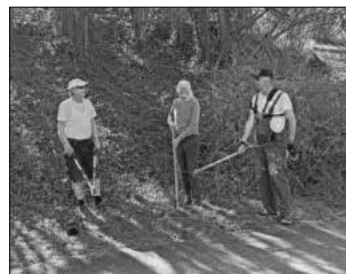
Das Team des Geschichts- und Bürgervereins in der Seibergstraße.

Ein Team des Geschichts- und Bürgervereins Heimbach hat unter fachkundiger Anleitung und intensiver Mitarbeit einer engagierten Bürgerin einen Hang an der Seibergstraße in Heimbach von störendem Bewuchs befreit. Die entsprechende Fläche war bekannt als Magerwiese mit der dafür typischen Artenvielfalt, selbst Orchideen konnten dort beobachtet werden. In den vergangenen Jahren war das Gelände allerdings zugewachsen und gegen starkwüchsige Brombeeren und Efeu konnte sich die ursprüngliche Vegetation inzwischen nicht mehr durchsetzen. Da eine Magerwiese auf einem geringen Stickstoffeintrag beruht, wurde das gesamte Mähgut bei der Aktion sorgfältig von der Fläche entfernt, damit sich die Wildblumen und Gräser über den Sommer wieder ungehindert ausbreiten können. Bereits einige Wochen zuvor wurde durch das Vereinsteam in einer ähnlichen Aktion eine zugewachsene Streuobstwiese der Gemeinde am Neuweg in Heimbach wieder zugänglich gemacht und somit ein Beitrag gegen die unerwünschte Verbuschung rund um den Ort geleistet. Falls jemand Interesse an der Bewirtschaftung der nun wieder begehbaren Streuobstwiese am Rand des Ortsteils Heimbach hat, kann er/sie sich gerne an die Gemeindeverwaltung Teningen wenden.