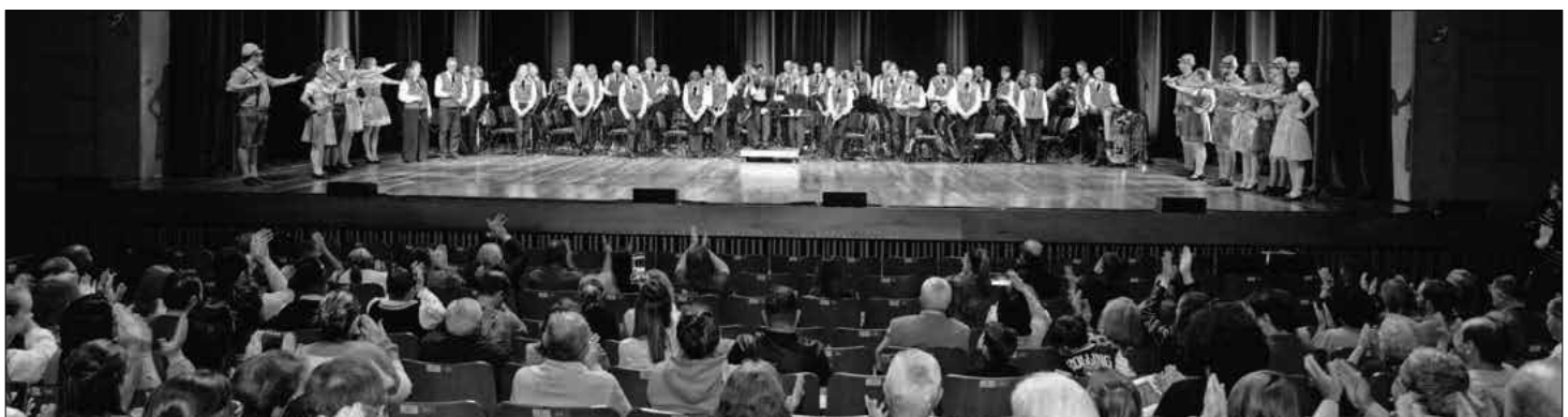
Die Winzerkapelle Köndringen im größten Theater Brasiliens.