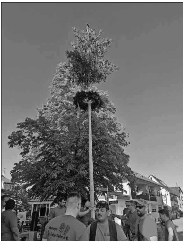
Maibaum stellen in Nimburg.

Im Anschluss wurde zu Ehren der Nacht der Hexen gemeinsam mit allen großen und kleinen Hexen und Teufeln in den Mai hineingefei-ert.