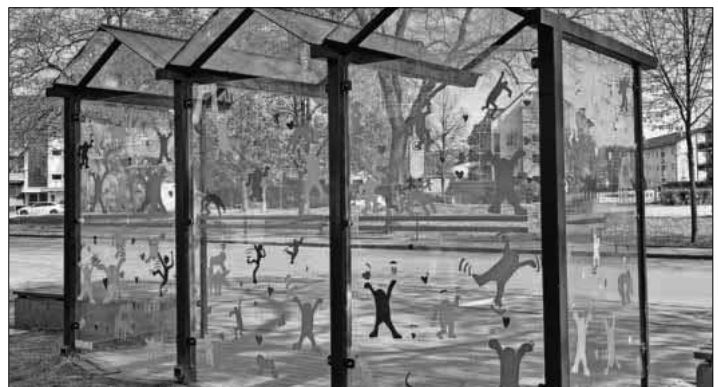
Bushaltestelle an der Ludwig-Jahn-Halle.

Den Kindern hat dieses Projekt viel Spaß bereitet. Sie haben nun auch einen guten Blick dafür bekommen, welche Glasflächen für die Vögel zur Gefahr werden können.