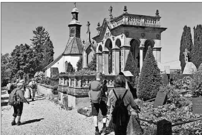
Bühlwegkirche und Friedhof.