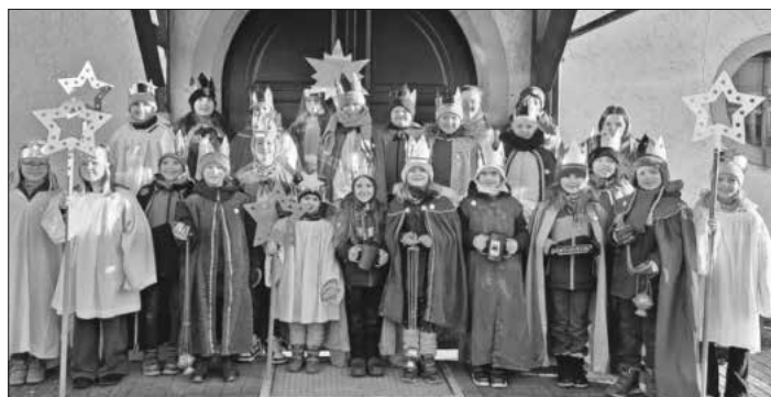
Aussendung der Sternsinger.

Im Gottesdienst am Sonntag, 4. Januar, in der katholischen Kirche St. Marien in Köndringen wurden die fünf Sternsingergruppen aus Teningen und Köndringen ausgesendet. Kreide, Segensaufkleber und Weihrauch wurden gesegnet. Am darauffolgenden Tag besuchten die Gruppen dann die Haushalte in Teningen und Köndringen und die Seniorenanlagen in Teningen wurden besucht. Wie es sich in den vergangenen Jahren bewährt hat, wurden Platzkonzerte abgehalten, damit sich alle Interessierten den Segen mit nach Hause nehmen konnten. Auch in den anderen Teninger Ortsteilen waren Sternsinger unterwegs, erteilten den Segen und sammelten Geld. Die diesjährige Sternsingeraktion galt den Kindern in Bangladesch, wo noch rund 1,8 Millionen Kinder und Jugend-