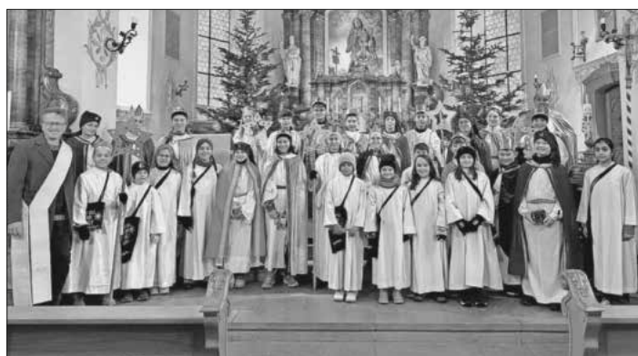
Die Sternsinger 2026 unterwegs in Heimbach.

Ein herzliches Dankeschön gilt den Kindern, die mit großer Freude und viel Engagement dabei waren, dem Sternsinger-Team und seinen Helfern für ihren Einsatz vor, während und nach der Aktion und nicht zuletzt allen Spendern. Mit den Spenden hoffen die Sternsinger, die Not der Kinder in Bangladesch und weltweit etwas lindern zu können und die Welt ein Stückchen besser zu machen.