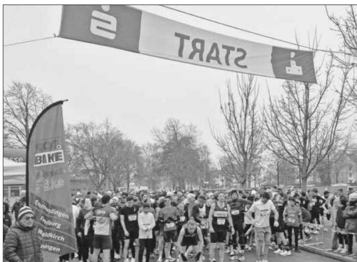
Start des Allmendlaufs.

Die bisherigen Anmeldungen für den Zehn-Kilometer-Lauf deuten auf ein großes Teilnehmerfeld hin, die Marke 500 Teilnehmerinnen und Teilnehmer ist fast erreicht; dabei sind auch