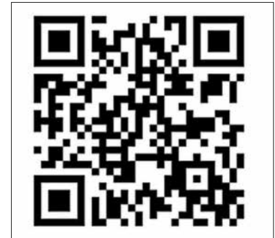
QR-Code zur Veranstaltung (Link siehe Text).

nanzieller Unterstützung richtet sie sich in erster Linie an Beschäftigte und Wiedereinsteigende. Beratung gibt es zu den Themen: Beruflich aufsteigen, Qualifikationen erweitern oder nachholen, Beruf wechseln oder beruflich wieder einsteigen.