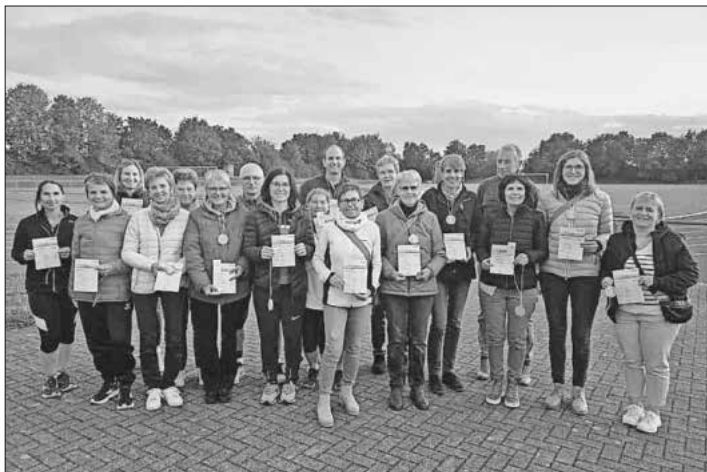
22 Teilnehmer haben das Sportabzeichen erhalten.

Die Sportabzeichengruppe geht jetzt in die Winterpause, die Laufeinheiten beginnen dann im Frühjahr 2026 – dazu wird es eine Information an dieser Stelle geben.