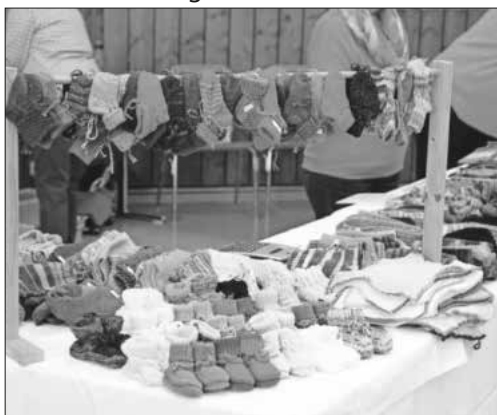
Rotkreuz-Basar: Gestricktes und Gehäkelt im Angebot.

Auf der Bühne wird traditionell die Musik- und Feuerwehrkapelle Teningen Platz nehmen und während der Mittagszeit für musikalische Unterhaltung sorgen. Für 14 Uhr hat erfreulicherweise die Kinderturniergruppe Connect des Tanzsportclubs Teningen zugesagt, die Gäste auf der Bühne mit ihrer Tanzkunst zu begeistern. Für die kleinen Besucher wird es eine