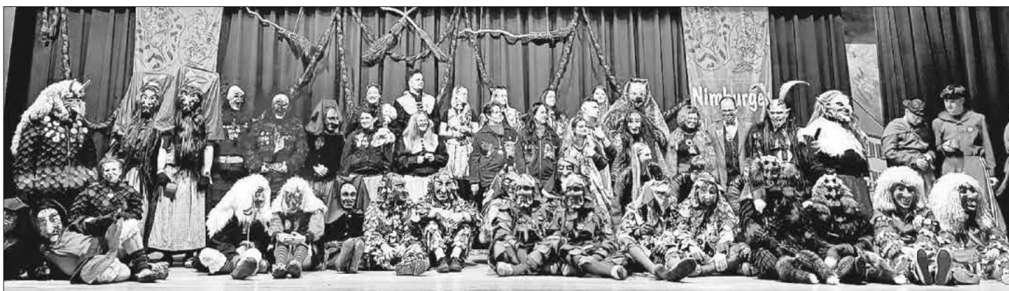
Einmarsch der Zünfte.

Am vergangenen Samstag war es endlich soweit, das vierte große Narrengelage der Nimburger Felse-Trieber fand in Anlehnung an das diesjährige Jubiläum unter dem Motto „50 Jahre Gesamtgemeinde Teningen“ statt.