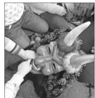
Waldteufel-Maske zum Anfassen.

Schuhe, Hose, Rollkragenpullover, Handschuhe, Halstuch: alles in schwarz, rot-gelbe Zacken mit Glöckchen unten an den Beinen, rote Socken, Bauchgürtel aus rot-gelben Zacken mit Schellen, grüner Umhang mit Filzzacken, Kuhwedel, Holzmaske mit „Fohrebibbele“! Dies alles gehört zum Häs der Heimbacher Waldteufel. Viele Kinder wissen schon genau Bescheid und können alle Details, ohne lange zu überlegen, benennen. Sind doch viele Kinder mit ihren Familien schon Mitglieder der ortsansässigen Fasnetzunft. Traditionell schauen Vertreter dieser Zunft vor Fastnacht im Kindergarten vorbei, um Brauchtum und Häs den Kindern näherzubringen. Trotz dem freundlichen Lächeln der Waldteufelmaske haben einige Kinder doch immer wieder gehörigen Respekt, vor allem vor den beiden spitzen Eckzähnen.