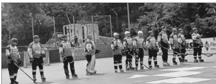
Spielbeginn am zweiten Spieltag in Nimburg.

Am 1. Juni fand in Nimburg der zweite Turniertag für die Herrenmannschaft der Crocodiles statt. Das schwülwarme Wetter verlangte allen Spielern einiges ab. Das fast ausschließlich aus eigenen Nachwuchsspielern bestehende Nimburger Team konnte die Spiele gegen Neuhausen und Hegau gewinnen. Lediglich gegen Ravensburg wurde es eng und man musste sich am Ende mit 2:3 geschlagen geben. Der Verein bedankt sich bei allen Helfern und Besuchern für den gelungenen Spieltag. Weiter geht es am 29. Juni in Schweningen.