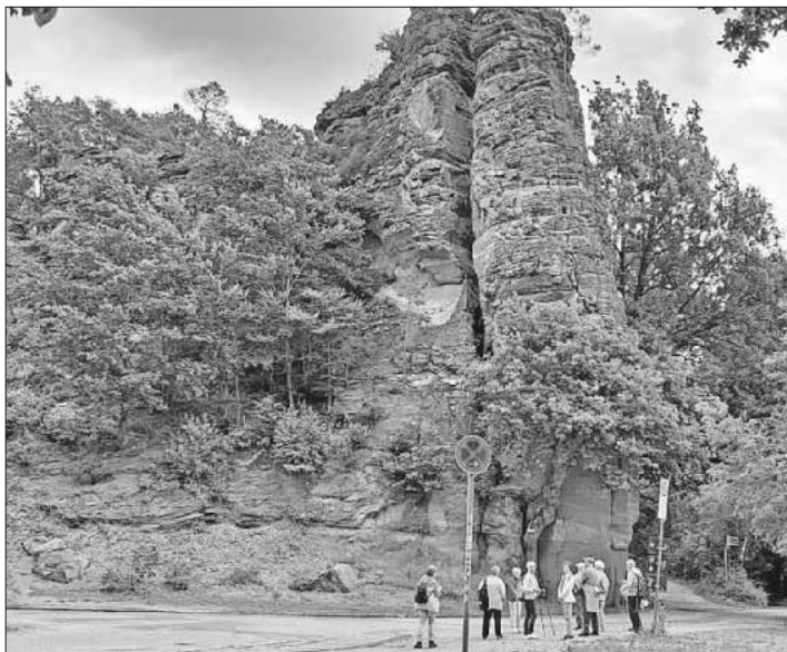
Die Felsformation „Braut und Bräutigam“.

Zum Schluss war Dahn mit seinem Felsenpfad das Ziel. Diese Wanderung durch die verschiedenen Felsformationen wie „Braut und Bräutigam“, Wachtfels, Jakobsfelsen, Satans-Brocken, Burgruine Neudahn, Felsentor, war Höhepunkt dieser Wandertage. Für alle waren es informative und gesellige Tage. Mehr Bilder unter www.schwarzwaldverein-Teningen.de .