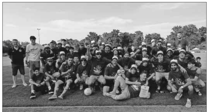
Die 1. Mannschaft des FV Nimburg feierte den Aufstieg in die Kreisliga A.

Das Spiel wurde von Gästeseite kurzfristig abgesagt. Die drei Punkte gewinnt der FVN am grünen Tisch.