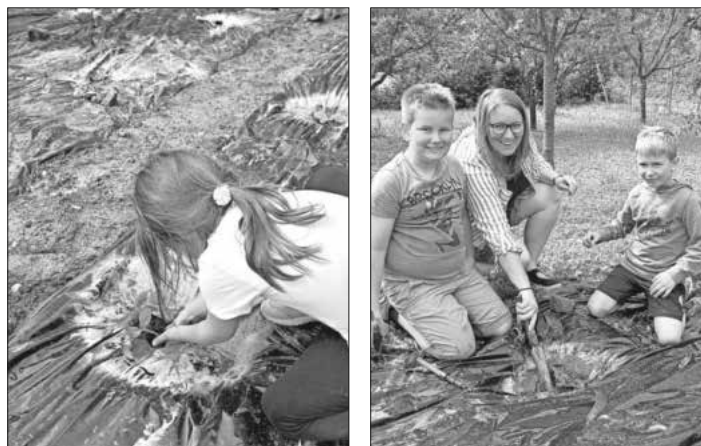
Die Kinder beim Pflanzen der Kürbisse.

Am Donnerstag vor einer Woche fand eine Kürbis-Pflanzaktion der LandFrauen statt, bei der rund 20 Kinder gemeinsam mit ihren Mamas, Papas und Omas einen schönen Mittag in der Natur verbrachten. Treffpunkt war der Spielplatz in der Wilhelm-Köllner-Straße in Köndringen, von wo aus gemeinsam zum Garten in den Reben marschiert wurde. Dort angekommen, gab es eine kurze Stärkung mit leckeren Zimtschnecken vom Ramstalhof. Voller Eifer und Stolz pflanzten die Kinder ihre eigenen Kürbisse für Halloween in die Erde. Nach dem Pflanzen wurden noch Samenbomben hergestellt, die zu Hause in den Gärten oder auf Wiesen gepflanzt werden können. Das Wetter hielt zum Glück perfekt, sodass alle viel Spaß hatten und den Mittag genießen konnten. Der LandFrauenverein freute sich über alle Teilnehmerinnen und Teilnehmer und freuen sich schon darauf, die Kürbisse gemeinsam zu schnitzen. Das Wachstum der Kürbisse bis zur Ernte kann verfolgt werden über den Link https://www.instagram.com/landfrauen.koendringenteningen?igsh=a2l3NHd3NTdsbjE4 .