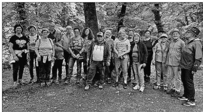
Die Teilnehmer beim Gesundheitswandern.

Das Teningen Rote Kreuz bietet wieder in Kooperation mit der Volkshochschule ab Dienstag, 28. Oktober, fünfmal dienstags von 9.30 bis 11.30 Uhr Gesundheitswanderungen an. Um Anmeldung unter Telefon 07641 / 9225-0, E-Mail info@vhs-em.de oder Internet www.vhs-em.de wird gebeten.