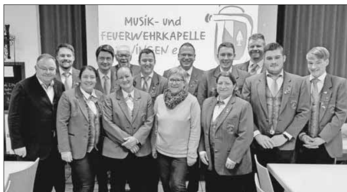
Bürgermeister Heinz-Rudolf Hagenacker mit dem wiedergewählten Vorstand der Musik- und Feuerwehrkapelle Teningen.