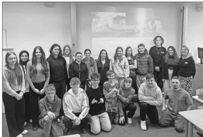
Die teilnehmenden Schülerinnen und Schüler.