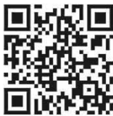
QR-Code zur Veranstaltung (Link siehe Text).

Ab sofort haben Kundinnen und Kunden der Bundesagentur für Arbeit (BA) die Möglichkeit, sich einen Passkey einzurichten, um sich besonders sicher an ihrem Konto anzumelden. Passkeys sind sehr einfach und komfortabel in der Handhabung und stellen eine sichere Alternative zu Passwörtern dar. Passkeys sind sogenannte digitale Schlüssel, die im Gegensatz zu Passwörtern nicht vergessen werden können, automatisiert erstellt werden und