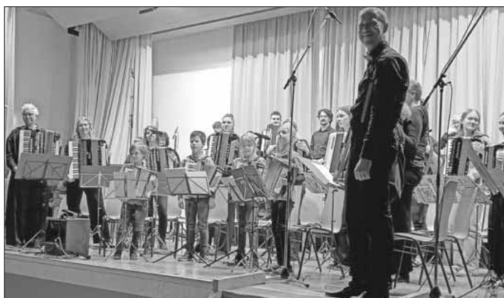
Von „Klein bis Groß“ auf der Showbühne.