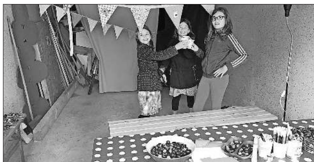
Die drei „Bastelmädchen“: Eine kleine Stärkung während der Arbeit haben sich die Drei redlich verdient.

Bereits 2015 ermöglichten die Schwestern einigen Flücht-