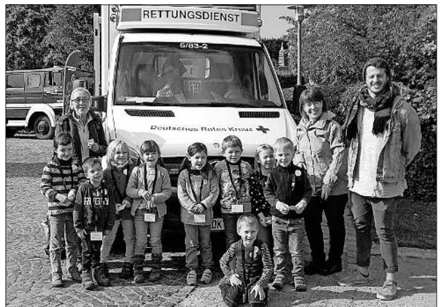
Die „ganz Großen“ des Katholischen Kindergartens St. Anna in Heimbach bei den Tagen des Wissens in Freiburg.

Höhepunkt war der Workshop „Rettungswagen“. Hier konnten die Kinder Spritzen aufziehen, Infusionen am Teddybär legen und feststellen, wie der Sauerstoffgehalt im Blut gemessen und ein EKG gemacht wird. Eine tolle Zaubershow mit „Mister Black“ bildete den Abschluss eines aufregenden Tages. Und so machte sich eine müde, aber glückliche Gruppe am Nachmittag wieder auf die lange Reise mit Straßenbahn und Bus zurück nach Heimbach, wo sie gespannt von ihren Eltern erwartet wurde.