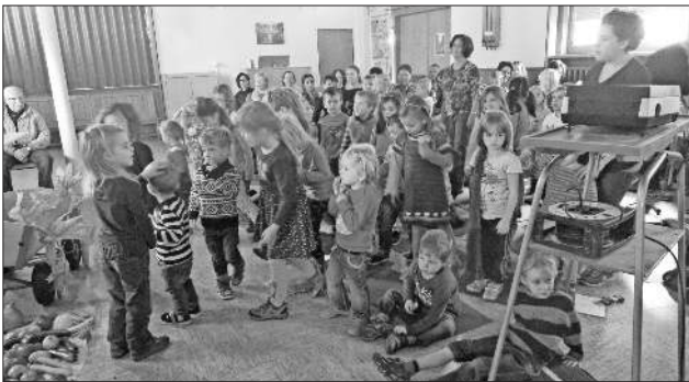
Alle hatten viel Spaß.

Nach dem Gottesdienst luden die Kindergartenkinder die Erntegaben in ihren Bollerwagen ein, woraus sie in der nächsten Woche eine leckere Suppe kochen können. Die Kinder, Erzieherinnen und Herr Sprich freuten sich über die vielen Gottesdienstbesucher.