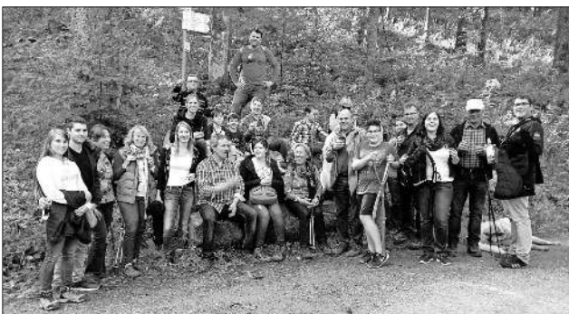
Natürlich durfte bei einer kleinen Laufpause auch ein Gläschen Eichstetter Wein nicht fehlen.

Am vergangenen Sonntag trafen sich Orchesterspieler und Vorstandsmitglieder der Akkordeon-Spielgemeinschaft Teningen und ihres Partnervereins, dem Akkordeonclub Eichstetten, mit Familien früh morgens an der Talstation der Schauinslandbahn und Freiburgs Hausberg wurde locker-leicht mit der Seilbahn erklimmt. Unten war die Rheinebene noch in Nebelfelder gehüllt und den Kaiserstuhl konnte man nur erahnen, aber oben stand die Sonne bereits in voller Pracht am Himmel. Nach einem leckeren Frühstück im Bergrestaurant war das nächste Ziel der Aussichtsturm, von wo aus man eine herrliche Sicht hatte – sogar bis zu den Alpen. Weiter ging's auf Schusters Rappen talwärts, vorbei an der Holzschlägermatte Richtung Horben und wieder hinab zur Talstation. In einer Straußli ließ man diesen wunderschönen Herbsttag noch gemeinsam ausklingen.