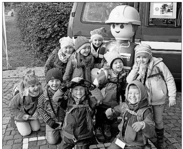
Mit Maskottchen „Balli“