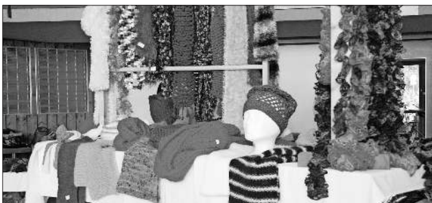
Bastelarbeiten im Angebot des Rotkreuz-Basars.

Nach dem Motto des DRK „Aus Liebe zum Menschen“ will das DRK seinen Wohltätigkeitsbasar auch in diesem Jahr wieder zum Erfolg werden lassen, um den älteren Mitbürgern, Behinderten und Kranken in der Gemeinde Gutes zu tun. Nur mit der Mithilfe der Basar-Besucher ist es jedes Jahr wieder möglich, diesen Menschen pünktlich zu Weihnachten eine Freude zu bereiten, indem ihnen ein kleines Geschenk zukommt. Deshalb freut sich das Deutsche Rote Kreuz, Ortsverein Teningen, auch jetzt schon darüber, seinen Besuchern einen schönen Tag am 1. November bereiten zu können. Aus Liebe zum Menschen.