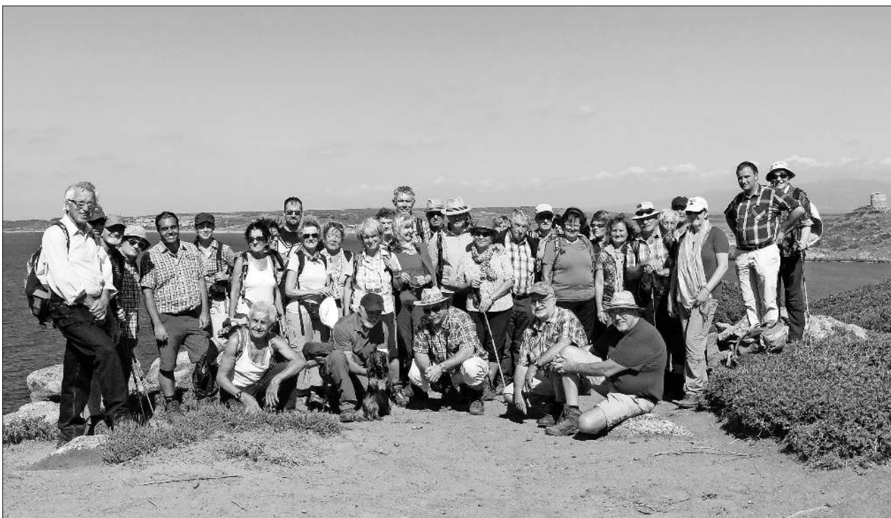
Begeisterte Wanderer bei Isola Rossa an der Nordküste Sardiniens, bezaubernd präsentiert sich die herbe Landschaft Sardiniens mit majestätischen Höhenzügen, karibischen Sandstränden und wilden Felslandschaften.

Info: Vom 7. bis 15. Juli 2017 ist eine Wanderwoche inmitten der Pyrenäen im Fürstentum Andorra und Lourdes geplant. Kontakt: Telefon 07641 / 47559.