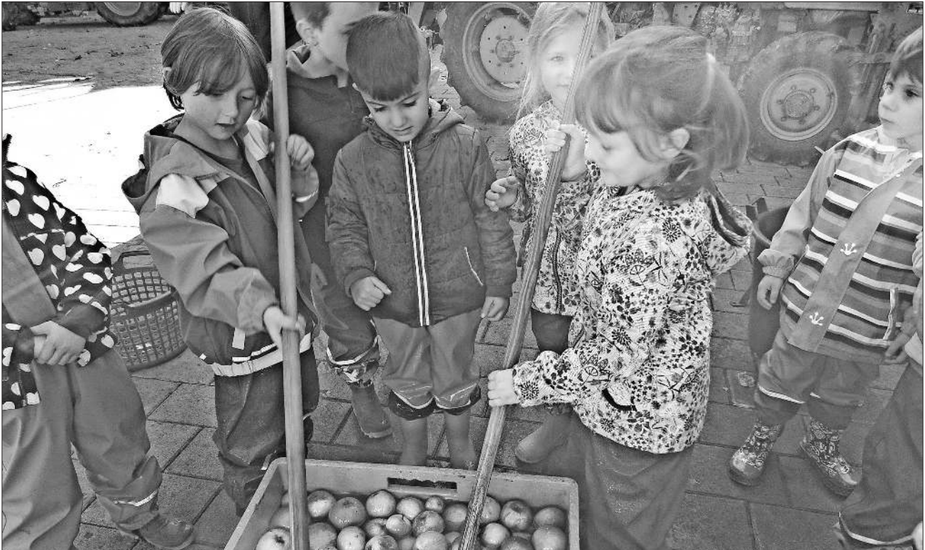
Die Äpfel wurden gemeinsam gewaschen ....