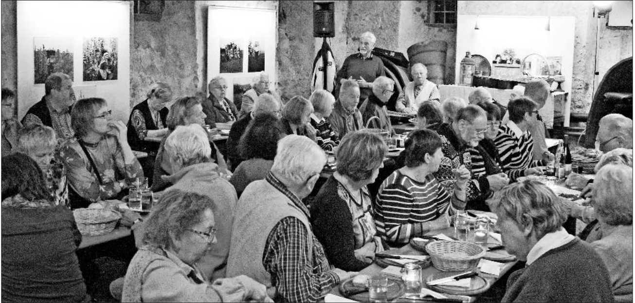
Bereits die vergangenen Jahre war der Mentonkeller gut gefüllt.

Beginn ist um 19 Uhr. Der Eintritt beträgt immer noch 3 Euro. Das Menton-Team freut sich auf viele Besucher.