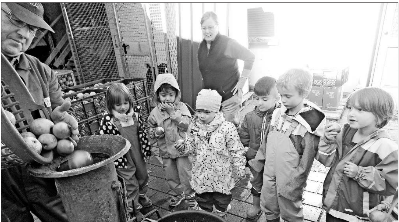
... und anschließend zerkleinert.