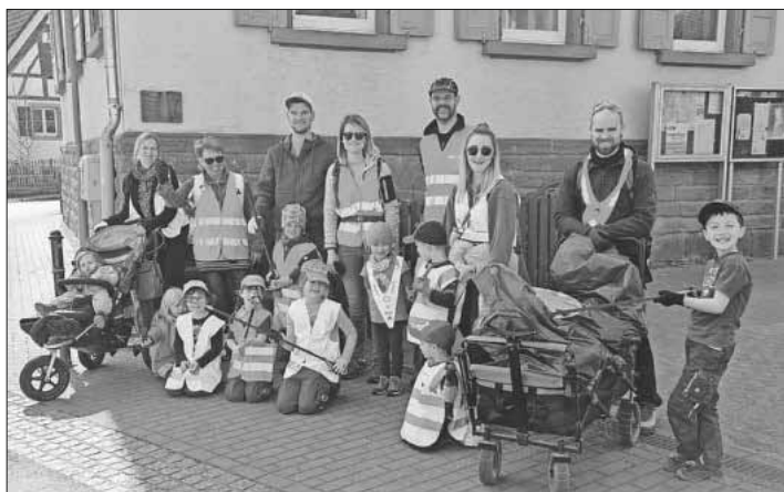
Auch der Kindergarten Villa Kunterbunt beteiligte sich an der diesjährigen Dorfputzete.

Ebenso wie viele Vereine der Gemeinde Teningen hat sich auch der Kindergarten Villa Kunterbunt Teningen, organisiert über den Elternbeirat, an der Dorfputzete beteiligt. Bei traumhaftem Wetter machte sich die Truppe aus Eltern und Kindern rund um Bottingen auf den Weg, solche Dinge einzusammeln, die achtlos weggeworfen wurden und für Menschen und Tiere gefährlich werden könnten. Dabei haben sich Eltern wie Kinder doch sehr gewundert, was Menschen einfach so in der Natur entsorgen. Neben gängigem Müll haben sie auch Schuhe, Radkappen oder Plastikplanen eingesammelt. Für alle Beteiligten war es ein sehr lehrreicher, aber auch lustiger Tag.