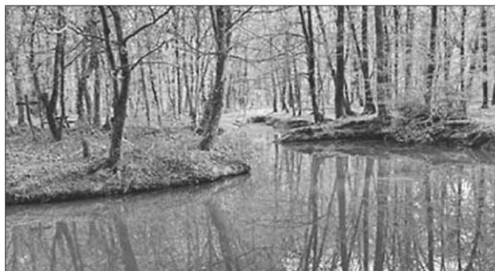
Der Waldsee in der Teningen Allmend.