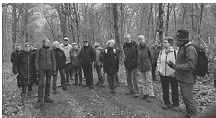
Die Teilnehmer bei der Führung durch den Allmendwald.