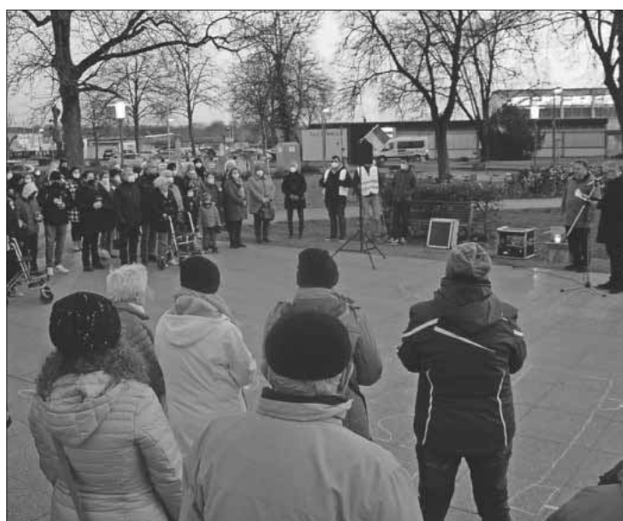
Tenger Bürger versammelten sich zur Mahnwache für Frieden in der Ukraine.

» Von 8 bis 12.30 Uhr bei der Metzgerei Feißt