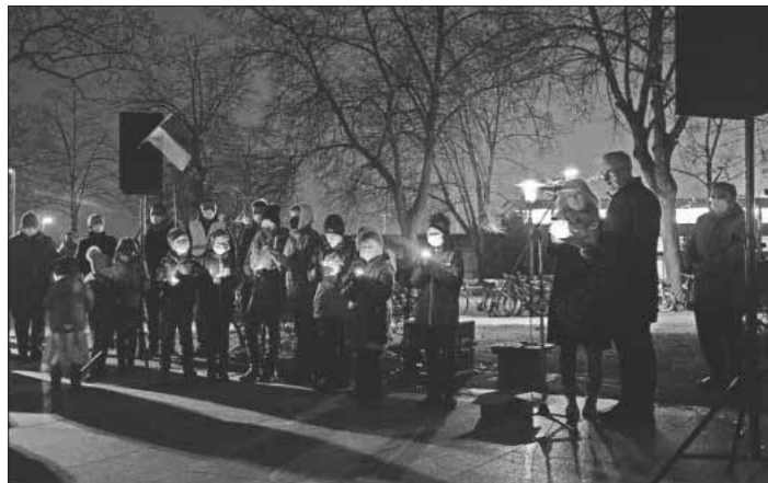
Zu jeder neu entzündeten Kerze wurde den Menschen in der Ukraine gedacht.