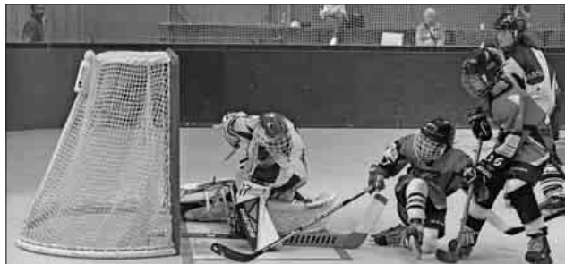
Nimbungs Torhüter Julius Weber pariert gegen zwei Gegner.

Nachwuchstraining findet immer montags und donnerstags um 18 Uhr am Nimbunger Inlinehockeyplatz statt.