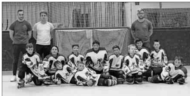
Schülermannschaft der SG Nimbung – Sasbach.