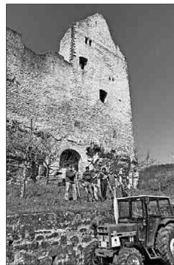
Arbeitseinsatz für die Burg Landeck.