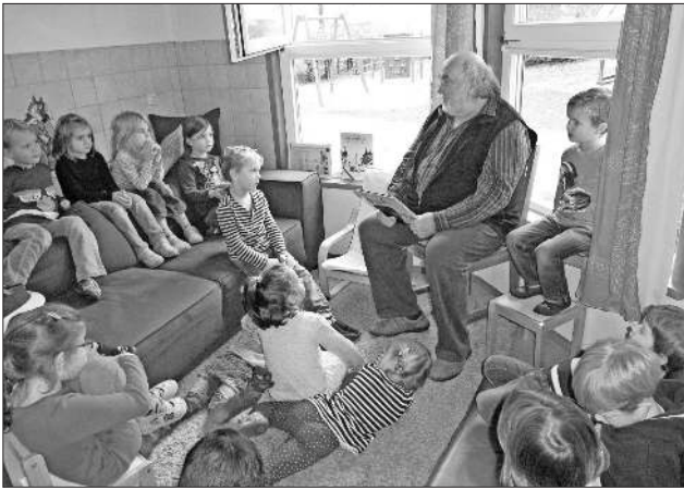
Gespannt wurde den vielen Geschichten gelauscht.

Den Vorlesern und den Erzieherinnen ein ganz herzliches Dankeschön für ihr Engagement.