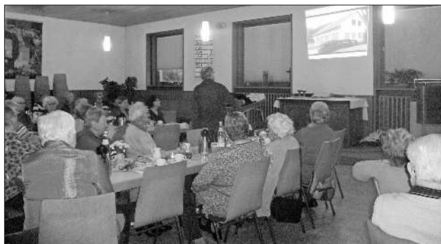
Aufmerksame Zuhörer beim Seniorennachmittag.

germeister, sei es zu Besuchen und zur Kontaktpflege. So hat er im Laufe der Jahre viele der Mönche näher kennengelernt und Freundschaften haben sich entwickelt.