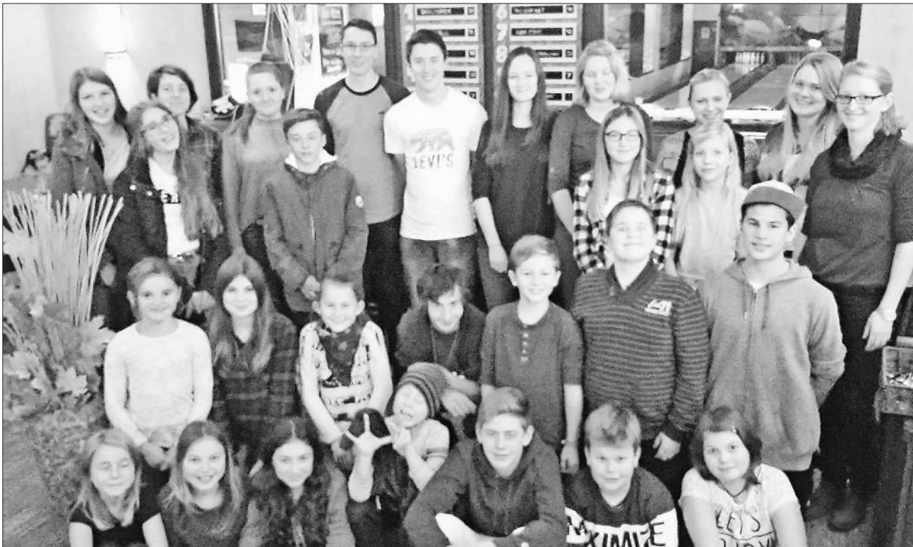
Beim diesjährigen Ausflug hatten die Jungmusiker viel Spaß.

Schon jetzt freuen sich die Kinder auf die nächsten gemeinsamen Aktivitäten. Informationen zur Jugendarbeit findet man unter www.mfk-teningen.de