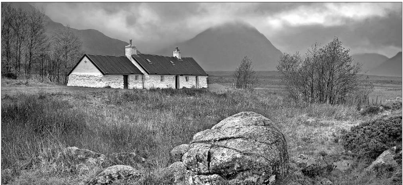
Impressionen aus Schottland