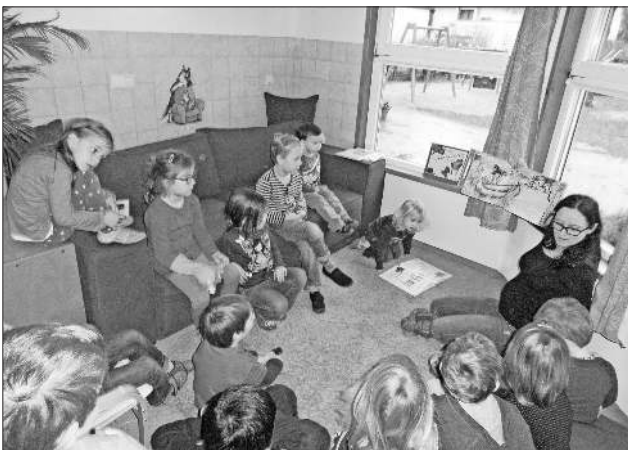
Mit Begeisterung dabei.