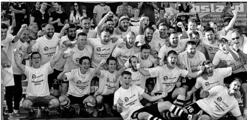
Die Teningen Mannschaft wurde erneut Meister und steigt nun in die Verbandsliga auf.