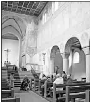
In der Kirche St. Georg in Oberzell.

Der zweite Reisetag war ganz der Klosterinsel Reichenau gewidmet, die heute zum Welterbe der UNESCO gehört. Die Führung startete bei der Kirche St. Georg in Oberzell. Sie ist eine der wenigen noch erhaltenen vorromanischen Kirchen und begeistert vor allem durch ihre Wandmalereien im Langhaus, die aus dem 10. Jahrhundert stammen und zu den frühesten erhaltenen nördlich der Alpen gehören. Weiter ging es zur Kirche St. Peter und Paul in Niederzell. Die dreischiffige Säulenbasilika wurde im 12. Jahrhundert gebaut und ersetzte den Gründungsbau von Bischof Egino von Verona aus dem 8. Jahrhundert. Aus dem frühen 12. Jahrhundert stammen die Wandmalereien der Apsis. Den Abschluss bildete der Besuch des Münsters Maria und Markus in Mittelzell, ehemals Benediktiner-Klosterkirche. Hier befand sich die früheste Anlage des Klosters Reichenau mit ein-