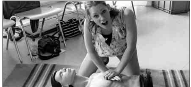
Geübt wird beim Kindernotfallkurs unter anderem die Wiederbelebung von Erwachsenen.

Das Teningen Rote Kreuz bietet in Kooperation mit der Volkshochschule Emmendingen am Samstag, 15. Juni , von 9 bis 13 Uhr einen Kindernotfallkurs an. Zielgruppe sind Eltern, Großeltern, Erzieherinnen und Erzieher, Tagesmütter, Babysitter und alle anderen Personen, die Kinder betreuen. Lehrgangsort: DRK-Heim , Neudorfstraße 40. Anmeldung: 07641 / 9225-0.