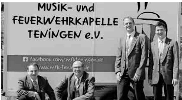
Die Vorstandschaft der Musik- und Feuerwehrkapelle Teningen und des Fördervereins freut sich auf alle Besucher beim diesjährigen Pfingsthock.

Am kommenden Samstag, 8. Juni, veranstaltet die Musik- und Feuerwehrkapelle Teningen ab 17 Uhr ihren 5. Pfingsthock auf dem Schulhof der Viktor-von-Scheffel-Schule. Was als gemütlicher Hock begann, feiert dieses Jahr bereits seine fünfte Auflage. Mit Grillwürsten, Winzerweckle und frisch gezapftem Bier ist der gemütliche und gesellige Charakter des Pfingsthocks aber immer noch garantiert. Die musikalische Unterhaltung wird in diesem Jahr von den Musikfreunden vom Musikverein Reute und dem Blechbläserquintett Heilig's Blechle aus Teningen und Köndringen übernommen. Mit dem nötigen Wissen und etwas Glück haben alle Besucher beim kostenlosen Quiz die Chance auf tolle Preise. Als besonderes Highlight für die kleineren Gäste wird es dieses Jahr wieder die Spielecke und eine Hüpfburg geben. Die Bewirtung wird erneut vom Förderverein der Musik- und Feuerwehrkapelle Teningen übernommen. Die Musik- und Feuerwehrkapelle Teningen freut sich, alle Interessierten recht herzlich zu einem gemütlichen Abend begrüßen zu dürfen.