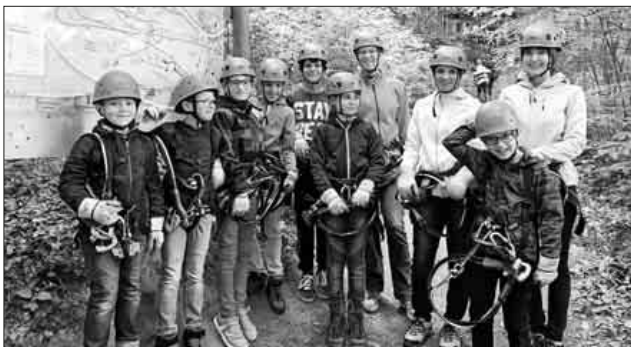
Voll ausgerüstet und bereit für das Abenteuer.

Nach einem aufregenden Tag und einem gemeinsamen Vesper ging es erschöpft und glücklich auf den Heimweg.