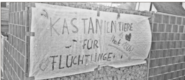
Ein großes Hinweisschild war für den Erfolg von Nutzen.