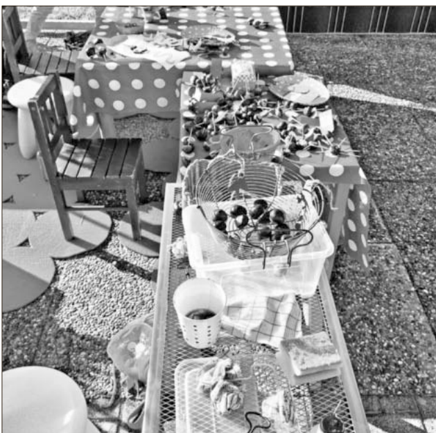
Was man aus Kastanien so alles machen kann!