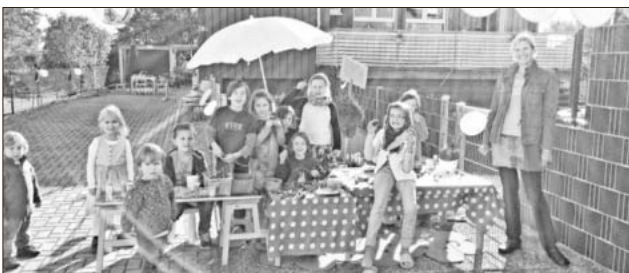
Sichtlichen Spaß brachte die Idee der Kastanientiere als Beitrag zur Flüchtlingshilfe.

Am Freitag, 2. Oktober, war es dann soweit: Der Verkauf startete um 15 Uhr in der Hindenburgstraße in Teningen. Die Kastanientiere wurden gegen eine Spende abgegeben. Die vielen Besucher nutzten das Angebot selbst zu basteln und erfreuten sich bei Sonne an Kaffee und leckerem Kuchen. Gesammelt wurden stolze 88,91 Euro, die am letzten Donnerstag im Rathaus dem Bürgermeister für die Flüchtlingshilfe übergeben wurden.