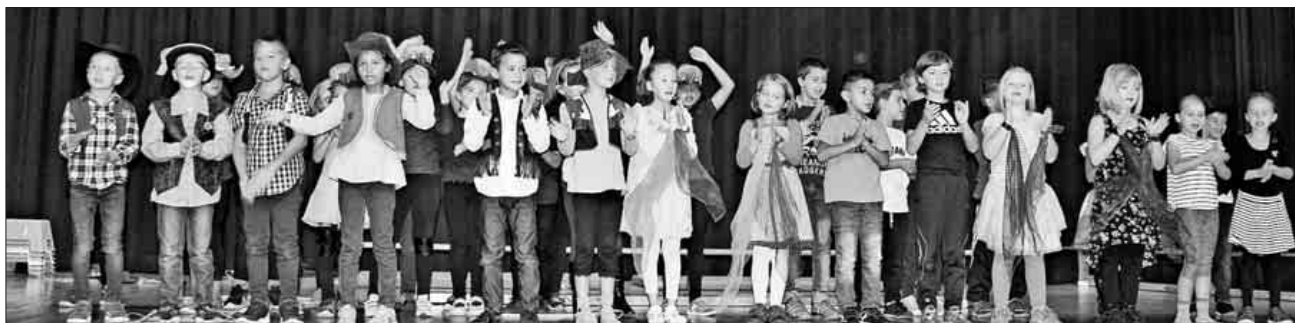
Die Zweitklässler bei der Aufführung zur Einschulungsfeier.

Im Anschluss begann für diese die erste Schulstunde. In der Zwischenzeit bewirteten die Eltern der 2. Klassen die wartenden Eltern und Gäste.