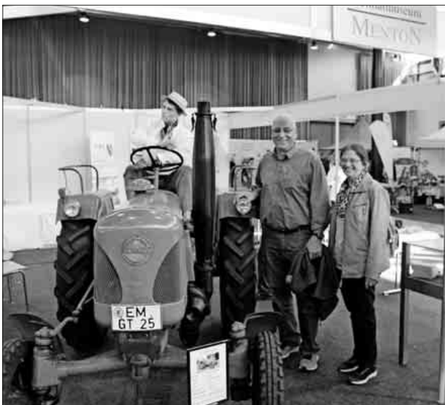
Der Lanz-Bulldog aus dem Jahr 1956 war der Hauptanziehungspunkt am Teninger Messestand.

Die 64. Baden-Messe ging am Sonntag mit einer erfolgreichen Gesamtbilanz zu Ende: Rund 71.000 Menschen haben die Messe mit ihren mehr als 450 Ausstellern besucht.