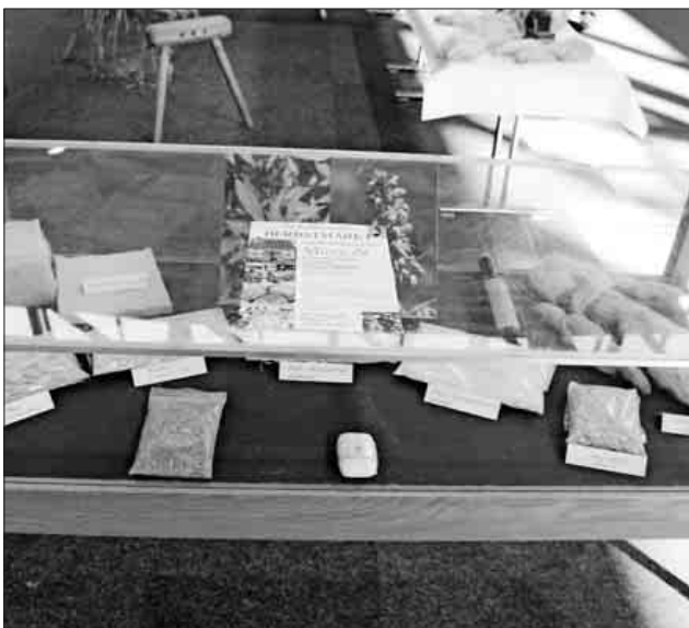
Rund um das Thema „Hanf“ ging es bei der Präsentation des Fördervereins Anwesen Menton.