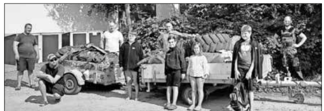
Bei der jährlichen Bachputzete am Mühlbach sammelte die ASV-Arbeitsgruppe zwei Anhänger voller Müll.

Im Zuge des Bachabschlages am Mühlbach trafen sich die ASV-Arbeitsgruppe und die Jungangler zum gemeinsamen Müllsammeln an Mühlbach und Niederwaldsee. Es ist immer wieder erstaunlich, welcher Unrat sich im Bachlauf befindet (beabsichtigt oder auch unbeabsichtigt). An die Mitbürger: Mühlbach schreibt man mit „h“ und nicht mit „doppel- l“. Dank gilt dem Bauhof Teningen, der dem ASV zwei Anhänger platzierte und den gesammelten Müll auch entsorgte.