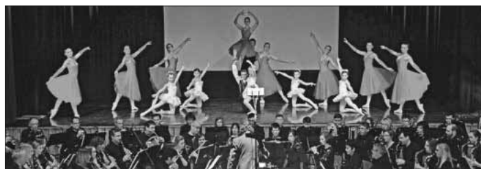
Die Gruppe des Elztäler-Ballett-Vereins aus Oberwinden und die Winzerkapelle Köndringen.

Ticketverkauf bis diesen Freitag bei der Aesculap-Apotheke Köndringen, bei Blum-Papeterie Teningen, Maurer Elektrotechnik in Emmendingen oder online unter www.winzerkapelle.de .