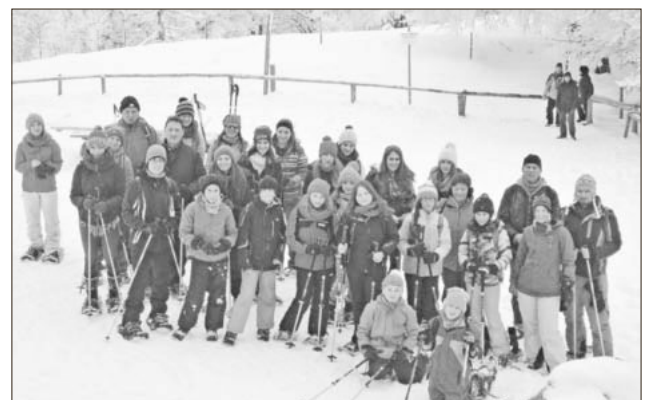
Die Teilnehmer im Schnee.

Ausdauertraining in ungewohntem Gelände unternahmen die Schüler- und Jugendleichtathleten des TuS Teningen. Mit Schneeschuhen und dick vermummt waren sie mit den Trainern/innen am Schauinsland in schönster Winterlandschaft unterwegs. Dabei wurde manche Muskelpartie, die im Hallentraining oder auf der Bahn im Emil-Schindler-Stadion nicht benötigt wird, auf das Äußerste gefordert. Entsprechend geschaffert war die Leichtathletengruppe dann am Ende der Tagestour – für die entsprechende Stärkung war allerdings gesorgt.