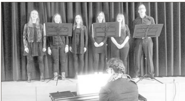
Der Köndringer Jugendchor Juke-Boxx in Aktion.