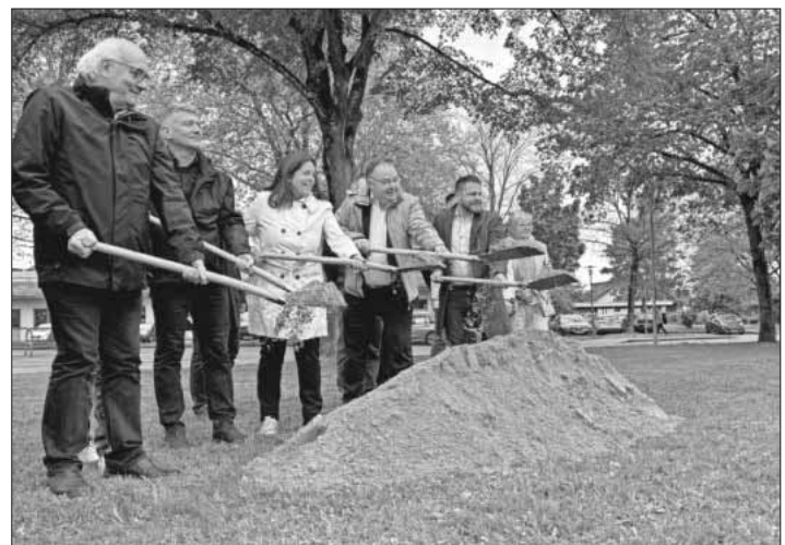
Der Spatenstich für den vierten Bauabschnitt der Erweiterung des Nahwärmenetzes in Teningen.