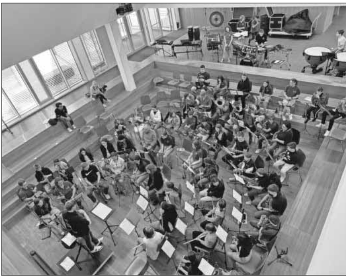
Die Nachwuchsmusikanten der Musik- und Feuerwehrkapelle Teningen beim gemeinsamen Probetag.

Am Samstag nahmen die Nachwuchsmusikanten der Musik- und Feuerwehrkapelle Teningen am gemeinsamen Probetag in Teningen für ein ganz besonderes Projekt teil. Gemeinsam mit den Jungmusikern aus der Winzerkapelle Köndringen, dem MV Heimbach, MV Nimburg/Bottingen und dem MV Maltedingen wurden einen Tag lang zusammen viele Stücke einstudiert. Zwischendurch wurden alle reichlich mit Chili- und Kartoffelsuppe sowie Kuchen versorgt. An diesem Tag lernten sich viele neue Leute und Kinder kennen und alle haben ein gemeinsames Hobby, das Musizieren. Die Jungmusiker, Dirigenten und Jugendleiter hatten sichtlich Spaß und freuen sich schon auf die nächste gemeinsame Probe. Denn am 8. Juni präsentieren die 80 Jungmusiker ihr gemeinsames Ziel der Proben bei einem Benefizkonzert in der Ludwig-Jahn-Halle.