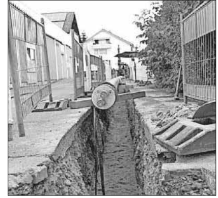
Das Teninger Wärmenetz wächst – hier ein früherer Bauabschnitt in der Feldbergstraße.

Über die Nahwärmeversorgung Teningen: Die Nahwärmeversorgung Teningen GmbH ist ein kommunales Unternehmen, das Wärmenetze in Teningen-Oberdorf, Heimbach und Köndringen betreibt. Die Gemeinde Teningen hält 75,1 Prozent der Anteile. 24,9 Prozent der Anteile hält die endura Beteiligungsgesellschaft mbH aus Freiburg.