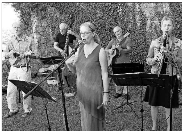
Die Vetterliswirtschaft hatten in der von Efeu begrenzten, jahrhundertealten Burgruine Landeck den idealen Rahmen für ihre „neutraditionelle“ Musik gefunden.

Das Publikum erklatschte sich eine Zugabe, die für die Vetterliswirtschaft Gelegenheit schuf, mit einer Sarabande aus der Renaissance durch kaum merkliches, ständiges Variieren in moderne Popmelodien zu führen, so als wollten sie das Versprechen dieses Serenatenkonzertes, zu dem der Kulturverein Teningen eingeladen hatte, wiederholen, das da lautete: Musik aus fünf Jahrhunderten.