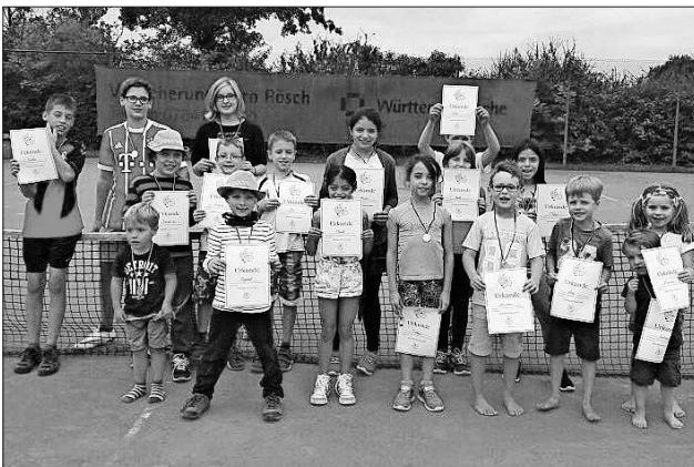
Die Teilnehmer waren begeistert.