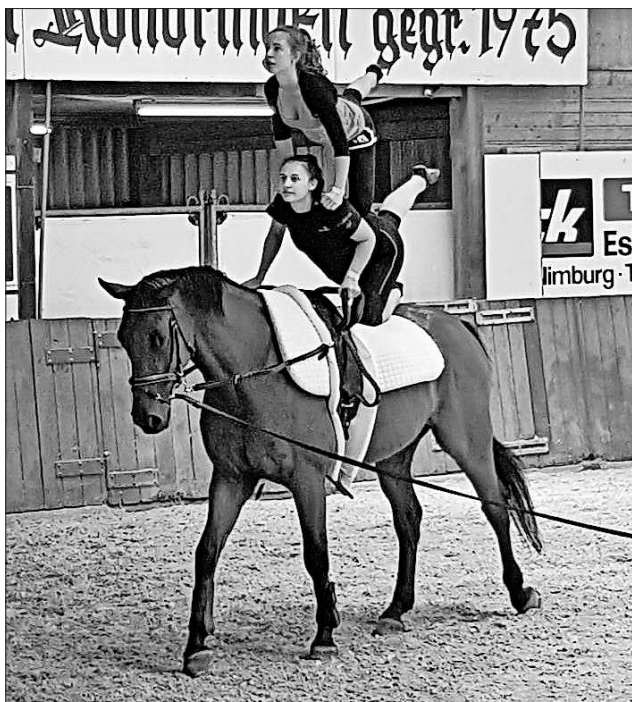
Turnen auf dem Team-Pferd.

Der Reitverein bedankt sich bei allen Helfern, die das Camp möglich gemacht haben, und bei allen Teilnehmern. Der Verein freut sich, die Voltigierer im nächsten Jahr wieder begrüßen zu dürfen.