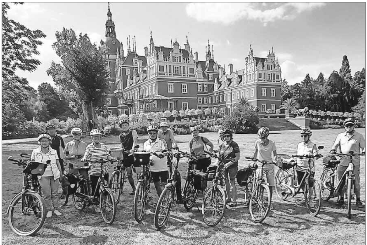
Die strahlenden Teilnehmer.

biet umfasst etwa 70 Mal 30 Kilometer und wird von Hauptsee und vielen Spreewaldarmen durchflossen, sogenannten Fließen. Einige davon wurden zu naturbelassenen Kanälen kreuz und quer mit Holzbrücken ausgebaut. Auf den Kanälen werden die Stocher-Kahnfahrten und die Paddelboote zum Selbstpaddeln angeboten. Motorisierte Boote sind nicht erlaubt. Das touristische Herzstück des Spreewaldes sind die Orte Burg, Lübbenau, Leipe, Lübben und das Lagunendorf Lehde. Typische Spreewaldprodukte als Mitbringsel sind Gurken in allen Variationen, Meerrettich und Leinöl, das aus dem früheren Haupterwerb, dem Spinnen von Leingarn aus Flachsfasern, als Nebenprodukt aus gerösteten Flachssamen hergestellt wurde und auch heute noch eine Spezialität ist. Bei schönem Sommerwetter hatten alle Teilnehmer eine erlebnisreiche und informative Woche. Bei den fünf Tagestouren wurden insgesamt 285 Kilometer Rad gefahren. Mehr Bilder auf der Homepage www.schwarzwaldverein-teningen.de .