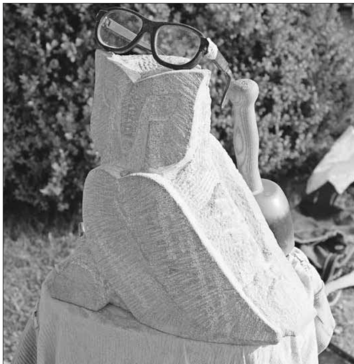
Werk aus dem letzten Jahr.

Die Anmeldung zum Kurs sowie Fragen per E-Mail an: g.u.bv.heimbach@gmail.com oder Tel. 07641 / 47102.