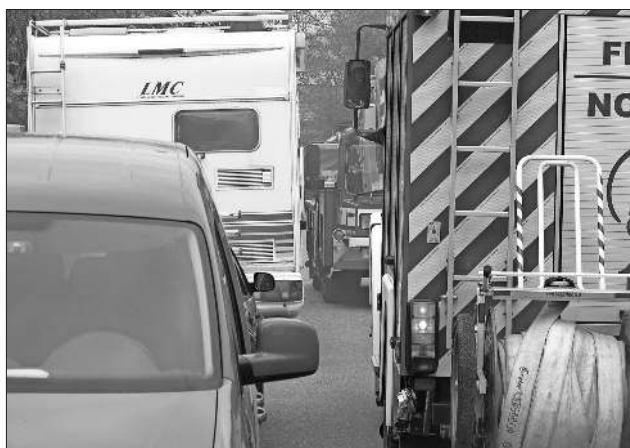
Für die Einsatzfahrzeuge ging es verdammt eng zu. Im Ernstfall würde dadurch wertvolle Zeit verloren gehen.