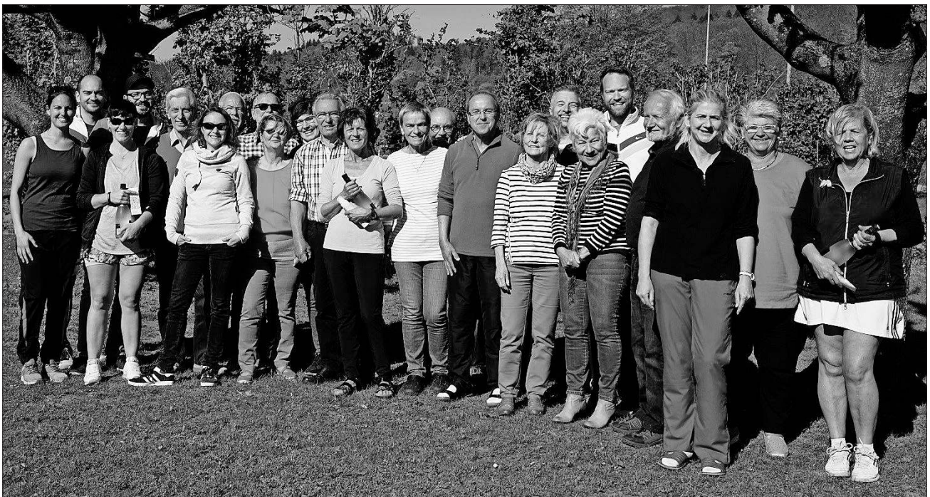
Die Teilnehmer beim Schleifchenturnier.

Nachdem nun bei besten Voraussetzungen die Tennissaison beim Tennisclub Heimbach gestartet wurde, steht auch schon gleich ein weiterer Höhepunkt an. Am kommenden Sonntag, 30. April, ab 10 Uhr wird die Doppelmeisterschaft ausgetragen. Der Club-Vorstand freut sich auf viele Anmeldungen und eine rege Beteiligung der Mitglieder auf der Anlage.