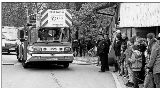
Auch für die Bürger war die Übung interessant.