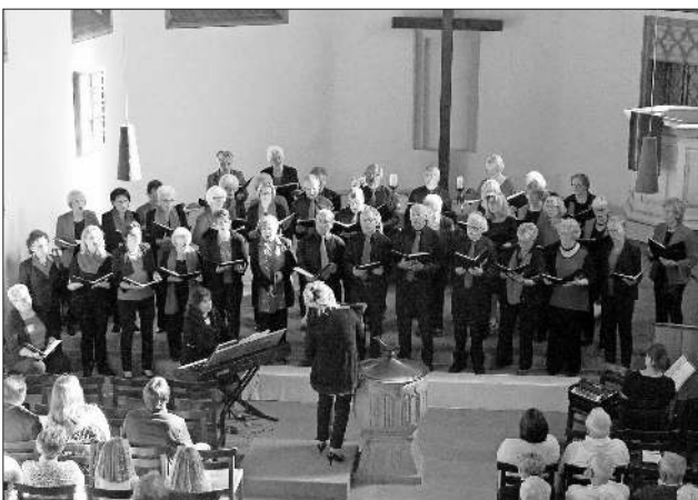
Der stattliche Gemischte Chor des Nimburger Gesangvereins stimmte mit zeitgerechten Liedern in der Bergkirche auf die Osterwoche ein.

Viel mehr Abwechslung in einem Konzert wie bei diesem in der Bergkirche zu Beginn der Karwoche konnte sich das Publikum nicht wünschen, das die Akteure zum Dank mit besonders viel Beifall überschüttete.