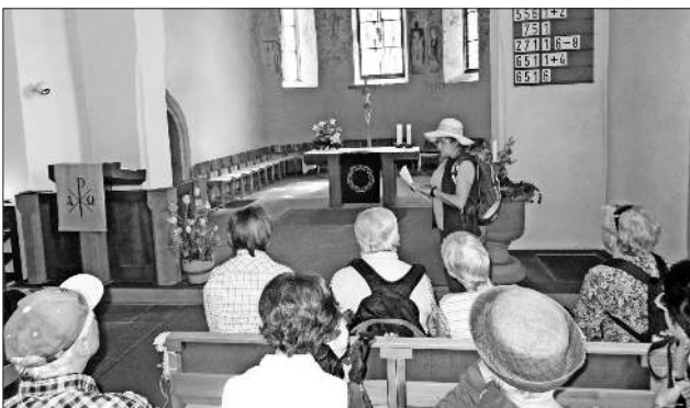
Die Wanderer in der St.-Laurentiuskirche in Bischoffingen

Gleich zu Beginn fand sich in der St.-Laurentiuskirche in Bischoffingen ein erstes Highlight: Dort wurden im Jahr 1909 Fresken aus dem 15. Jahrhundert entdeckt, die unter anderem den „Weltenbaum“, die Geschichte Buddhas aus christlicher Sicht, darstellen. Nachdem diese ausgiebig bewundert worden war, ging es steil hinauf zur Schelinger Viehweide, die seit 2012 Naturschutzgebiet ist. Dort erfuhren die Teilnehmer Interessantes über die hier beheimateten seltenen und gefährdeten Tier- und Pflanzenarten. Bestaunt wurden vor allem die Nandus, eine große Laufvogelart, die einem Rasenmäher gleich alles fressen, was Rinder und Schafe verschmähen: Brennnesseln, Vogelmiere und sogar Nacktschnecken. Unterhalb der Katharinenkapelle führte der Weg dann bergab zum nächsten und zugleich ältesten Naturschutzgebiet des Kaiserstuhls, der Amolterer Heide. Durch beeindruckende Lösshohlwege gelangten die Wanderer schließlich nach Endingen und ließen diesen erlebnisreichen Tag bei einer gemütlichen Einkehr in der Dielbuck-Schänke ausklingen.