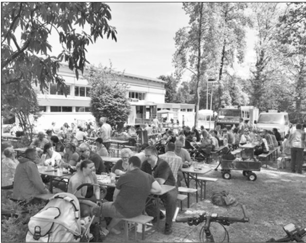
Gut besuchter Vatertagshock 2017.

Die Abteilung Nimburg-Bottingen veranstaltet am 10. Mai den Vatertagshock an der Nimberghalle in Nimburg. Auf die Besucher wartet ein reichhaltiges Speise- und Getränkeangebot wie zum Beispiel Gyros mit Pommes und Zaziki, Curry- und Grillwürste, Weizenbier, Bier, Wein und natürlich auch alkoholfreie Getränke. Nachmittags gibt es auch Kaffee und Kuchen in einer idyllischen Umgebung direkt an der Glotter mit großen Bäumen und Sonnenschirmen. Auf die kleinen Gäste wartet ein Spielbereich mit einer großen Auswahl an Spielen aus dem Spielmobil der Gemeinde Teningen. Bei hoffentlich schönstem Maiwetter freuen sich die Kameraden der Feuerwehr auf viel Besuch.