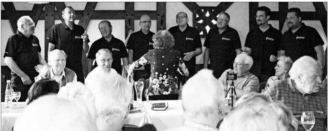
Die Vokalisatoren begeisterten mit einem bunten gesanglichen Geburtstagsstrauß.

Insgesamt eine sehr gelungene Jubiläumsfeier mit familiärem Charakter, von der man sich wünscht, dass sie in fünf oder zehn Jahren in derselben Frische erneut stattfinden kann.