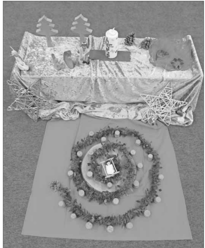
Weihnachtstisch mit Hl. Familie und Adventsspirale.