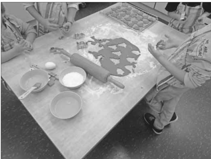
„In der Weihnachtsbäckerei“ im Kindergarten.

Die Kinder und Erzieherinnen des Katholischen Kindergartens St. Anna in Heimbach wünschen allen ein frohes und besinnliches Weihnachtsfest, einen gesunden Start ins neue Jahr und freuen sich darauf, Ende Januar wieder vom Kindergarten berichten zu können.