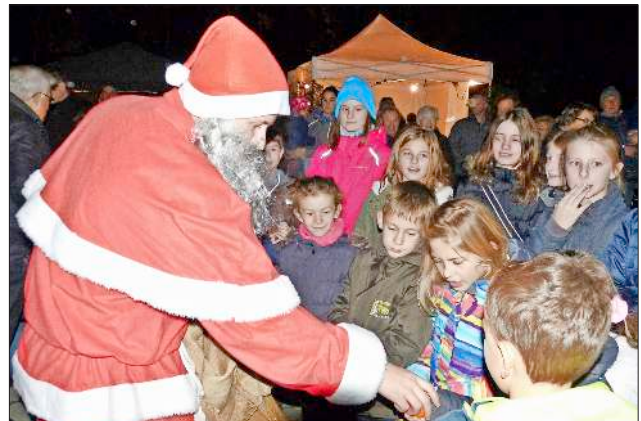
Auch der Nikolaus schaute zur Freude der Kinder in Heimbach vorbei.