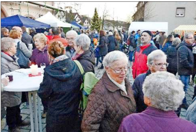
Auf dem Heimbacher Weihnachtsmarkt trifft man sich immer wieder gerne.