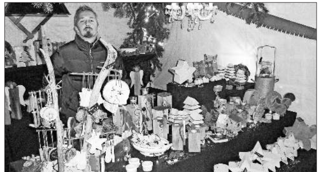
Gebastelte Weihnachtsmotive lockten zum Sehen und zum Kaufen.