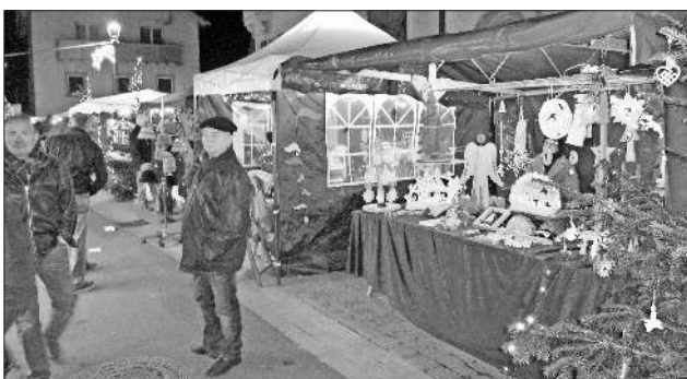
Viele dekorative Stände verwandelten die Riegeler Straße in eine Einkaufspromenade.

Der große Platz bot auch Raum zum Verzehr des „Mentönle“, einem selbst geschaffenen Getränk mit Bratapfellok, Zimt und Sahnemütze. Es gab hier auch leckeren Glühwein, der aber viel mehr auf der Schlemmer-Meile am Dorfbach seine Anhänger fand und wo am Samstagabend der Besuchergang oft fremdbestimmt war, so groß war die Gästezahl, die mit einem riesengro-