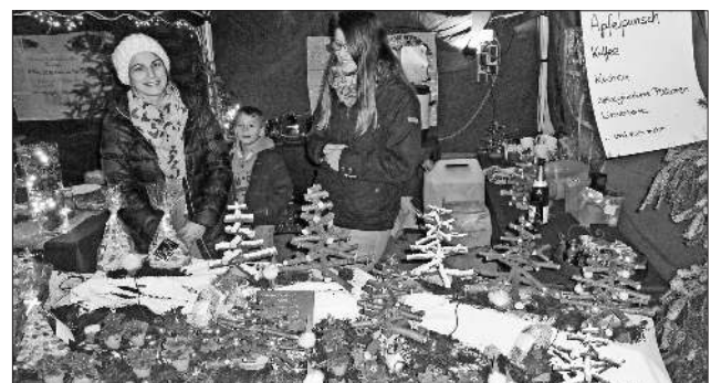
Viel Arbeit hatten sich die Kinder des Waldkindergartens gemacht, um für ihre Sache zu werben.