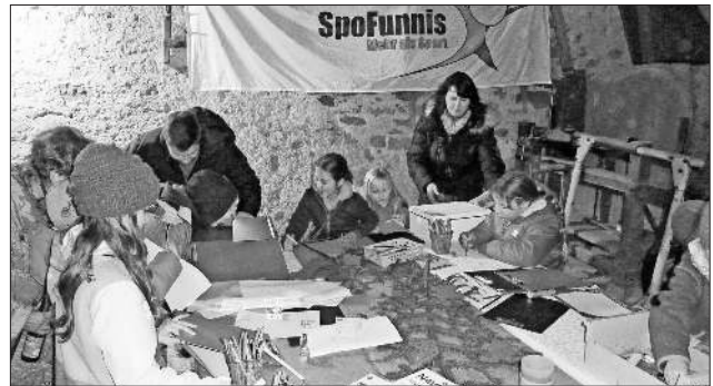
Die Spofunnis trugen mit ihrer Malerwerkstatt dazu bei, dass die Eltern in Ruhe den Teninger Weihnachtsmarkt erkunden konnten.

Fröhliche und nachdenkliche Musik stand am Sonntagmittag, schon um 14 Uhr mit dem Jugendorchester der Winzerkapelle auf dem Programm und der Kinderchor Lollipop des Ge-