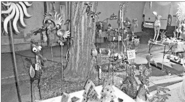
Aus den Landen der Fantasie hatten sich seltsame Geschöpfe auf dem Teninger Weihnachtsmarkt eingefunden.

sangvereins Köndringen und auch die Vocal Voices traten auf. So wurde dann die Wartezeit verkürzt auf die Verlosung des Weihnachtspreisträgers durch den Gewerbeverein Teningen.