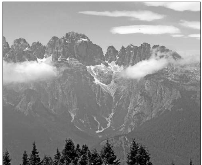
Wanderwoche im Juni in den Brentadolomiten (Trentino).