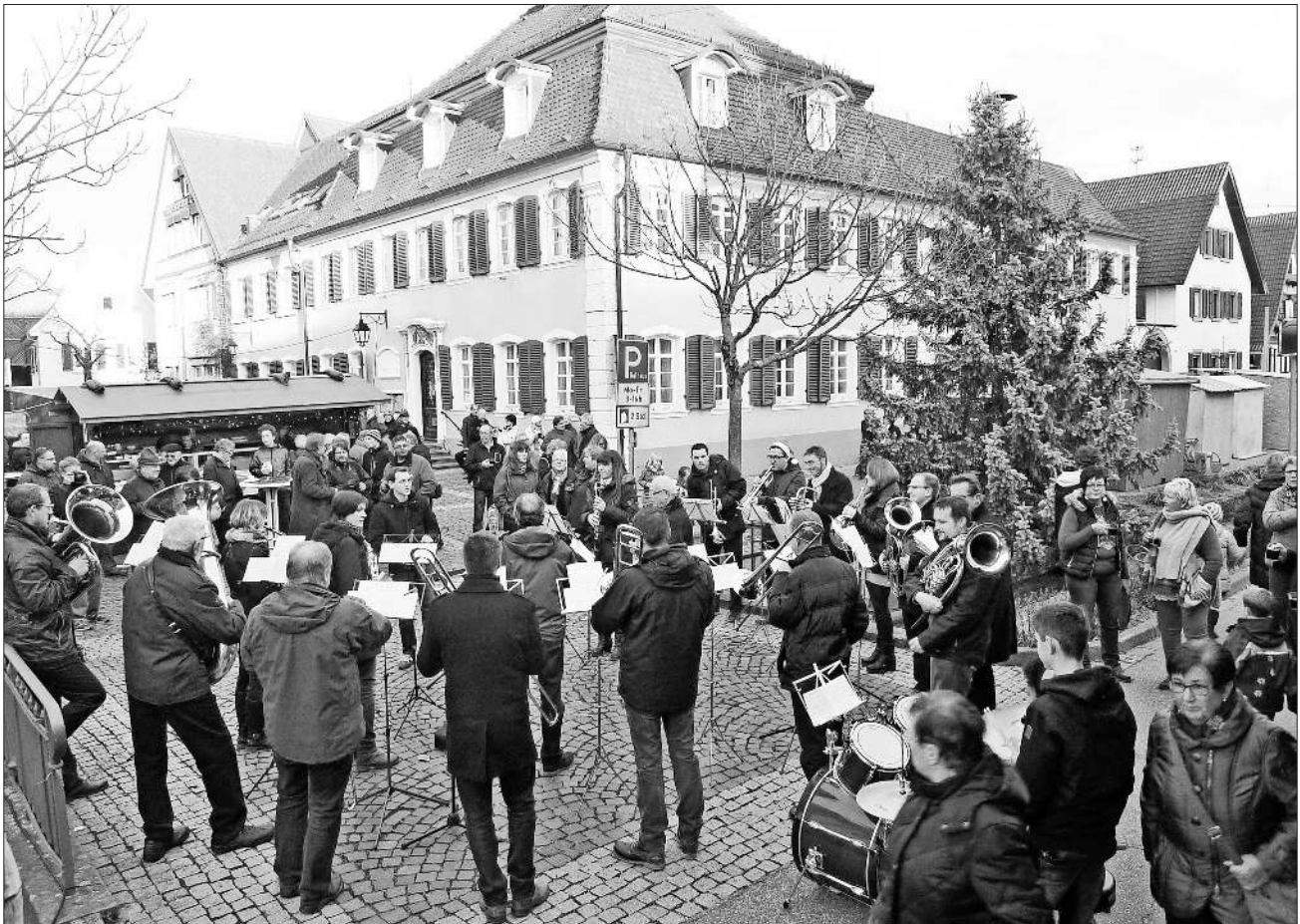
Der 41. Teninger Weihnachtsmarkt wurde vom Heimbacher Musikverein eröffnet mit swingenden, amerikanischen Songs und traditionellen deutschen Weihnachtsliedern.