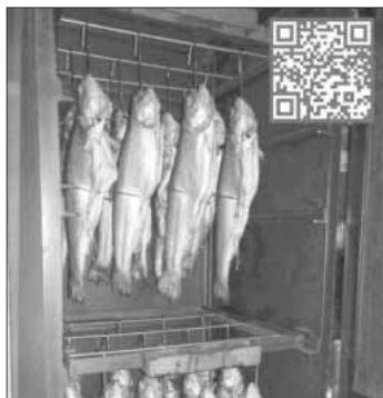
QR-Code für das Bestellformular.

Bestellungen sind bis Freitag, 22. September, um 12 Uhr möglich. Bitte die Bestellung dann am Sonntag, 24. September, zwischen 11 und 15 Uhr auf dem Vereinsgelände des ASV Teningen am Nimburger Baggersee abholen. Ein Kauf ohne Vorbestellung ist ebenfalls (bis 16 Uhr) möglich, jedoch nur solange der Vorrat reicht. Der ASV Teningen freut sich auf regen Besuch und über die Unterstützung und wünscht guten Appetit.