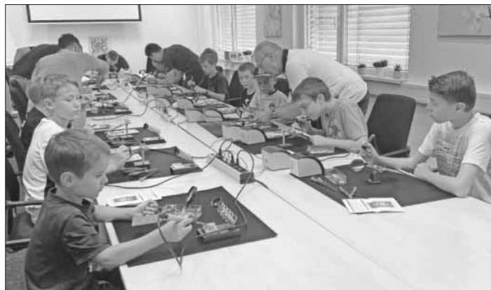
Kinder und Jugendliche sind von der Technik begeistert.

Eltern- und Großelternkaffee; Tennisclub Teningen: Tennis-Sommernachmittag; CVJM Teningen: Zeltlager; Mediathek Teningen: Bastelnachmittag „Figurentheater“; Kinder- und Jugendbüro Teningen: Soccergolf, Planetarium, Minigolf, Museumsbesuche, Bowling.