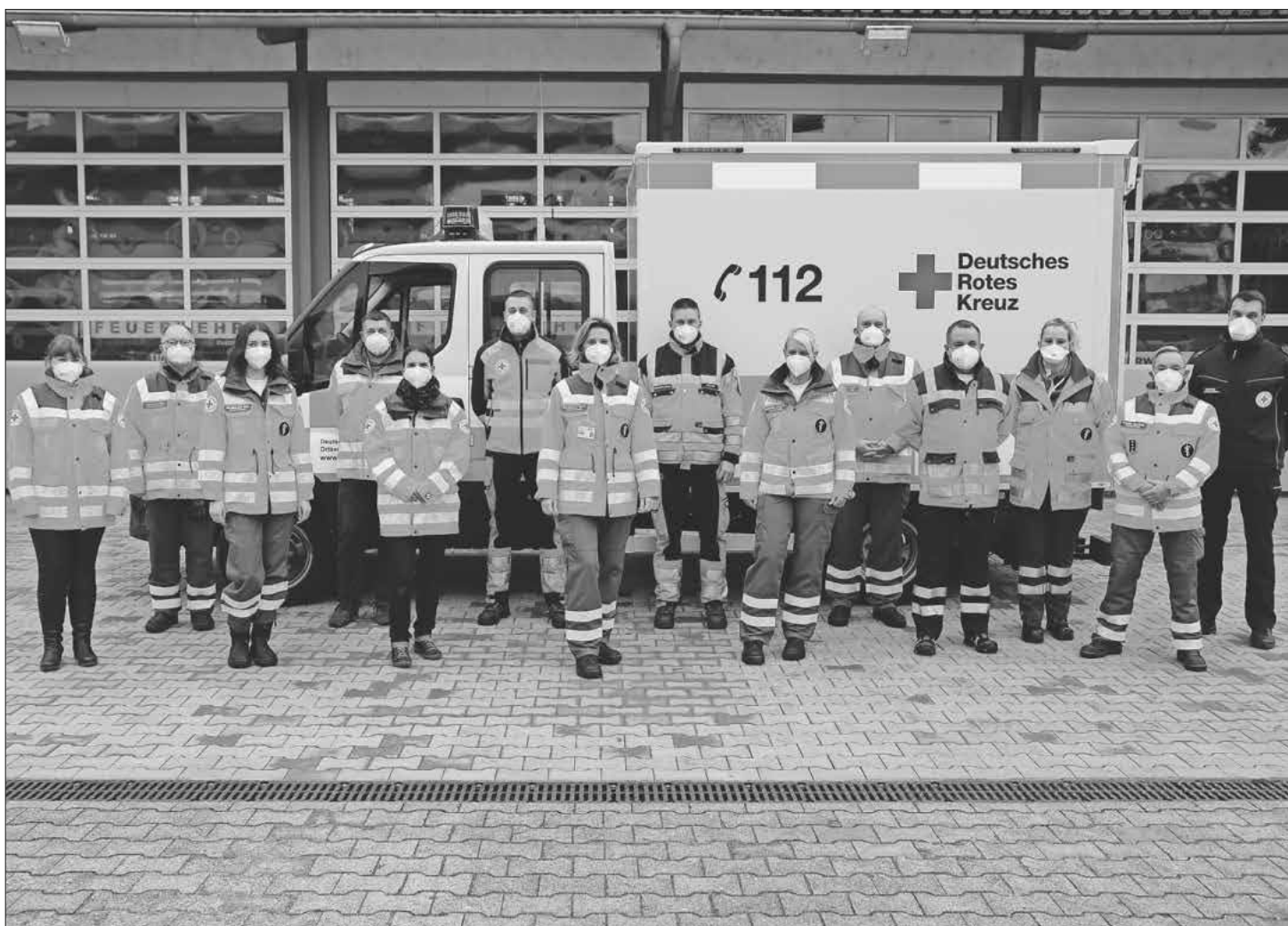
Helferinnen und Helfer der HvO-Gruppe Teningen.

Seit dem 1. März ist die HvO-Gruppe alarmbereit und kann mit den momentan zur Verfügung stehenden Mitteln zum Einsatz ausrücken. Um die Helferinnen und Helfer so zu alarmieren, dass ihr Weg zum Einsatzort möglichst kurz ist, wurde die Gruppe in zwei Bereiche geteilt. Ein Bereich umfasst den Kernort Teningen sowie Nimburg und Bottingen. Der zweite Bereich umfasst Heimbach, Köndringen und Landeck.