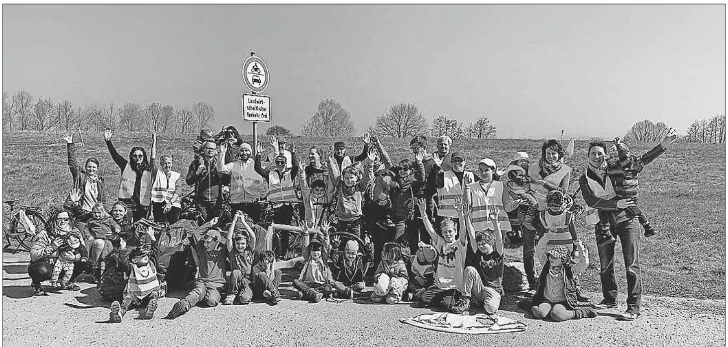
25 Kinder des Katholischen Kindergarten St. Franziskus, ihre Eltern und Erzieher beteiligten sich an der Teninger Dorfputzete.

Und noch etwas haben die Teilnehmer an manchen roten Wangen gemerkt: Auch im März hat die Sonne schon ganz schön viel Kraft!