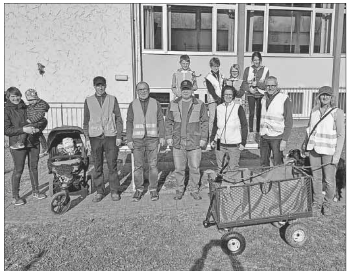
Die Mannschaft des Musikvereins machte sich auf zur Dorfputzete.

Am vergangenen Samstag führte die Gemeinde Teningen erstmals eine Dorfputzete durch. Mit dabei war auch der Musikverein Heimbach. Die Sammelbereiche erstreckten sich von Blumberg über Hungerberg bis zu Kenzelberg, Hinterfeld und Höpfeleweg. So konnte man die Umgebung des Dorfes noch schöner machen und gleichzeitig wurde die Vereinskasse durch eine Spende der Gemeinde aufge bessert. Der Ostermarkt in Teningen bot anschließend Gelegenheit zur Stärkung.