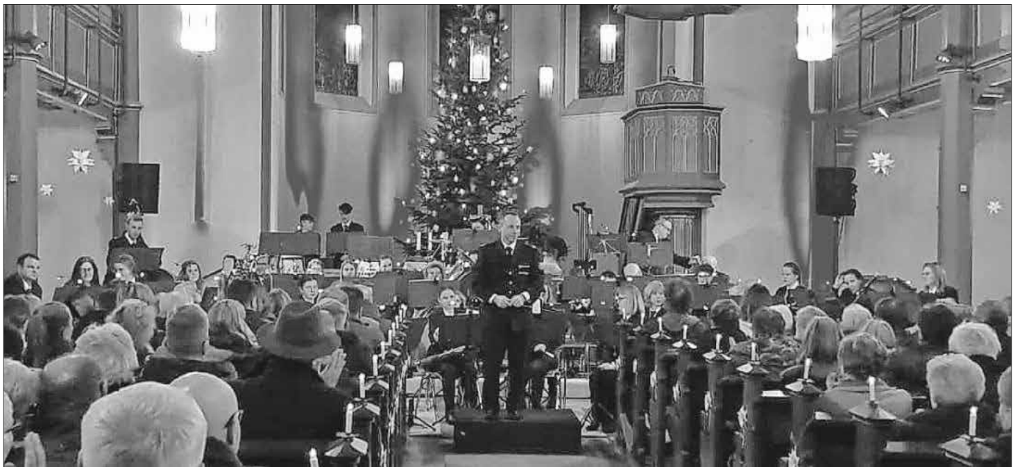
Der Spielmanns- und Musikzug der FFW Köndringen beim Stephanskonzert.

Diese Spende wird an einem gesonderten Termin demnächst übergeben.