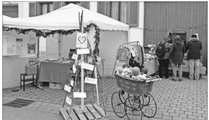
Wunschbaum am Stand von AWO und Sorgender Gemeinde beim Teningen Weihnachtsmarkt.

In Teningen war nebenan der Stand der Sorgenden Gemeinde, der auf das Angebot „Senienschwätzle“ der evangelischen Kirchengemeinde hingewiesen hat.