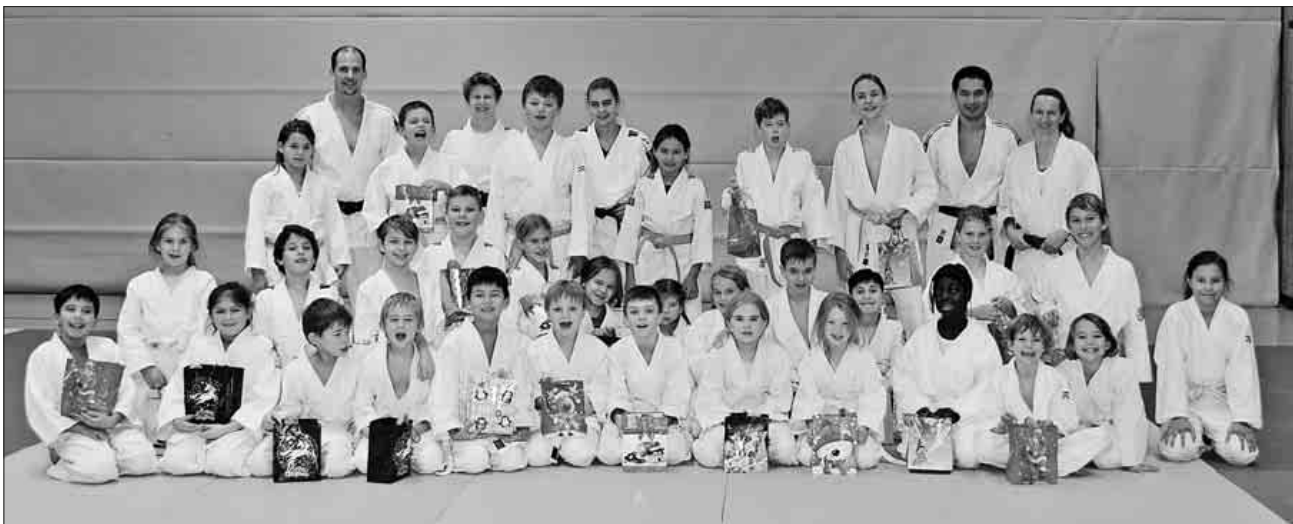
Die Judo-Kinder freuten sich über das Nikolausgeschenk.

Die Vorstandschaft der Judoabteilung bedankt sich bei allen Trainern, Helfern und Eltern für ihre Unterstützung und Hilfe in diesem Jahr und wünscht noch eine schöne Adventszeit, erholsame, besinnliche Weihnachtstage und einen guten Rutsch ins neue Jahr. Gut erholt geht es ab dem 9. Januar 2019 wieder mit dem Training weiter.