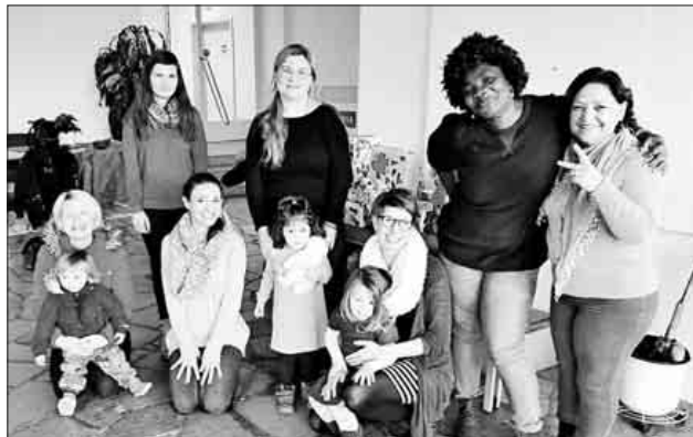
Die Frauen und Kinder freuten sich über die mit Spenden gefüllten Schuhkartons.

milien der Dreikäsehoch's, bei den Vereinsmitgliedern, allen Gönnern, Spendern und nicht zuletzt bei der Gemeinde für die Unterstützung und die sehr gute Zusammenarbeit bedanken. Der Verein wird am kommenden Wochenende mit einem Stand auf dem Teninger Weihnachtsmarkt vertreten sein und wünscht allen Gemeindemitgliedern eine besinnliche Weihnachtszeit.