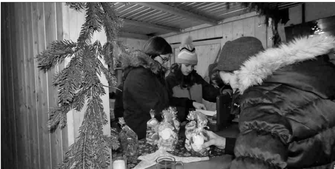
Selbstgebackene Weihnachtsbrödle sind immer wieder beliebt.