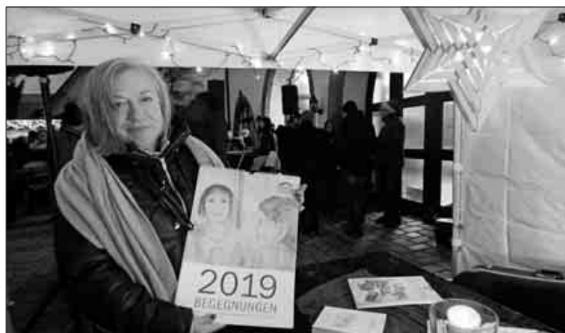
Beim Stand vom Geschichts- und Bürgerverein konnten die Besucher einen Kalender mit reproduzierten Werken der letzten Pater-Donatus-Ausstellung erwerben.