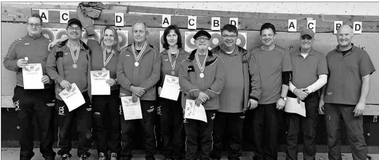
Der Teninger Bogenschützenverein holte bei den Kreismeisterschaften neun Einzelmedaillen.

Die Kreismeisterschaft ist gleichzeitig die Qualifikation zur Landesmeisterschaft, welche Ende Januar in Villingen stattfindet.