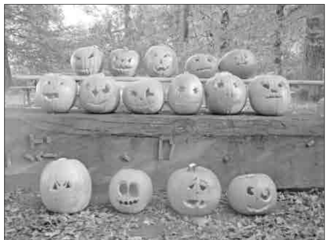
Die Kinder zeigten beim Kürbisschnitzen viel Kreativität, sodass es am Ende 15 gruselige Kürbisse zu bestaunen gab.

Ob mit Vorlage oder ohne, Sternenaugen oder Vampirzähne, die Kinder zeigten viel Kreativität, sodass es am Ende 15 gruselige Kürbisse zu bestaunen gab. Trotz des schönen Wetters blies ein kalter Wind, das Lagerfeuer zum Aufwärmen wurde besonders von den Erwachsenen geschätzt. Am Ende gab es zur Stärkung noch Kürbissuppe für alle. Da die Aktion eine sehr gute Resonanz fand, soll sie im nächsten Jahr wiederholt werden.