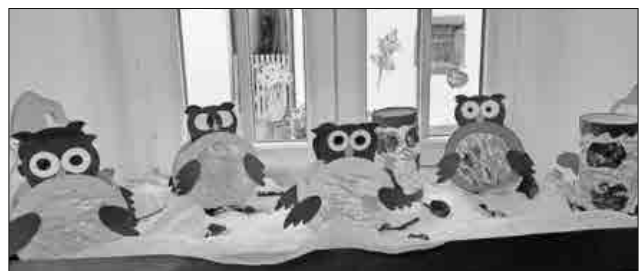
Die fertigen Laternen, die beim Elterntreff gebastelt wurden.

In der Kita wird den Kindern zurzeit einmal die Woche die Geschichte der Heule-Eule erzählt. Da im Herbst auch ein Apfelprojekt durchgeführt wird, konnten sich die Kinder entweder eine Apfel-Laterne oder eine Eulen-Laterne aussuchen. Mit der Marmeladentechnik bereiteten die Kinder mit den Erzieherinnen die Laternen vor. Die Eltern hatten nur noch die Aufgabe, die Einzelteile zu einer Laterne zusammenzufügen. Anschließend saßen die Eltern noch in gemütlicher Runde zum Austausch zusammen. An diesem Abend bestand die 2-G-Regel sowie das Abstandsgebot.