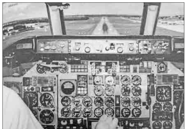
Ein Blick aus dem Cockpit – so sah die Aussicht der Piloten in ihrer Maschine damals aus – auch da hat sich viel geändert.