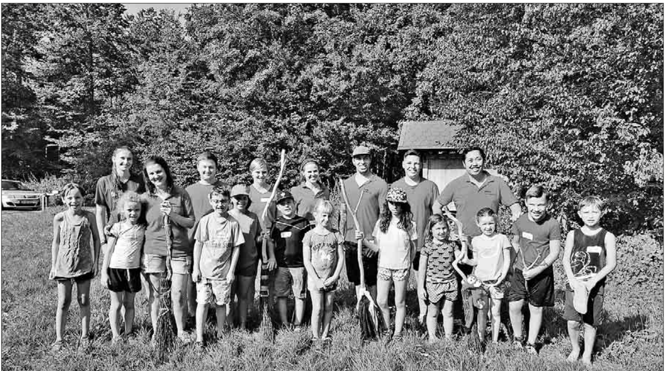
Die teilnehmenden Kinder mit den Nimburger Felse-Trieber bei der Sommerferienaktion „Schlag den Felse-Trieber 2.0“.

testet, um zu sehen, welche geeignet sind. Bei „Korken umspritzen“ konnten sie im Übungsspiel ca. 150 Treffer erzielen, bei der Sommerferienspielaktion merkten sie allerdings sehr schnell, dass sie gegen die Wassergeister in diesem Spiel keine Chance hatten, denn die Kinder waren nach Ende des Spiels bei 293 Treffern! Die Nimburger Felse-Trieber mussten bei diesem Spiel die weiße Fahne ziehen und aufgeben. Bei dem nächsten Wettkampf ging es um Schnelligkeit, hier gewann das Team, welches mit einem Wasser vollgezogenen Schwamm am schnellsten ein Glas füllen konnte. Hier erzielten die Nimburger Felse-Trieber den Punkte-Ausgleich. Das Brezel-Seilspiel sollte die Entscheidung bringen, welche Mannschaft gewinnt. Bei diesem Spiel wurden die Salzbrezeln auf eine Schnur aufgefädelt. Wer am schnellsten alle Brezeln aufgegessen hatte, hat gewonnen. Mit diesem Spiel haben die Wassergeister den Wettkampf „Schlag den Felse-Trieber 2.0“ für sich entschieden. Bevor der Tag zu Ende ging, konnten sich alle bei einer Runde Wasserbomben-Schlacht austoben. Zum Abschluss gab es für jeden noch ein Eis. Die Nimburger Felse-Trieber müssen wohl jetzt schon mit Üben anfangen, wenn sie nächstes Jahr „Schlag den Felse-Trieber 3.0“ für sich entscheiden wollen und sich damit den ersten Titel holen wollen.