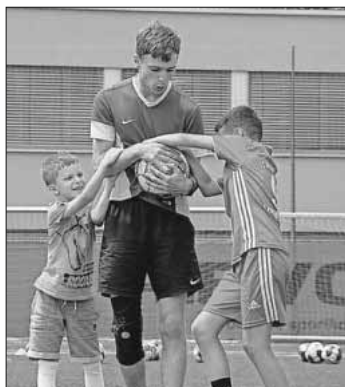
Kampf um den Ball wird trainiert.

Über 30 Jungen und Mädchen im Alter von sechs bis 13 Jahren lernten mit Spiel, Spaß und verschiedenen Übungen ihr Selbstvertrauen zu stärken. Den Trainern war es auch wichtig, die Teams altersgemischt einzuteilen, um die Kinder in ihren sozialen Kompetenzen zu stärken. „Gesunde Ernährung geht Hand in Hand mit Sport und Bewegung“, so das goal4U-Team. Somit konnten sich die Kinder in der Mittagszeit mit frisch zubereitetem, vegetarischem Essen stärken. Um im Thema Nachhaltigkeit Alternativen aufzuzeigen, bekamen die Kinder zum Abschluss keine gekauften Trikots, sondern durften ihre ausgetragenen eigenen Trikots mitbringen, um diese untereinander zu tauschen. Das war für alle ein neues Erlebnis und bereitete viel Spaß. Am Ende des Camps gingen die Kinder mit vielen neuen Erfahrungen und Erlebnissen nach Hause. Vom 8. bis 12. August geht das Fußballcamp, im Rahmen des Teninger Ferienspaßes, in die zweite Runde. Das Thema für dieses Camp lautet: „Gelassenheit auf und neben dem Platz entwickeln“. Das goal4U-Team freut sich über viele Kinder, die Spaß am Fußballspielen haben. Alle Infos und die Anmeldung unter: https://goal4u.de/sommerncamp-teningen/ .