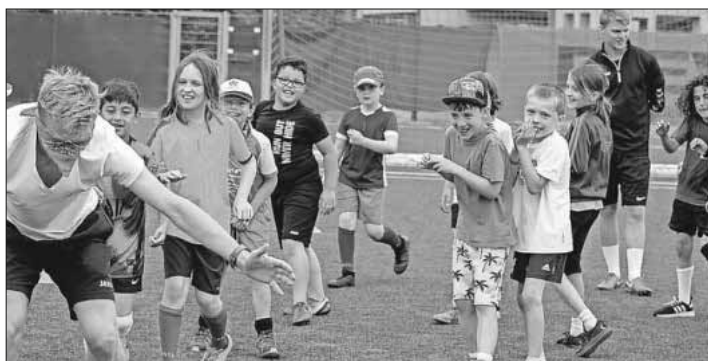
Die Kinder hatten viel Spaß im Camp.