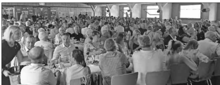
250 geladene Gäste feierten in der Winzerhalle das 50-jährige Jubiläum der SG Köndringen/Teningen.

Was als berufliche Kooperation der beiden Unternehmer begann, hat nun in der Zusammenarbeit in der SG ihren Höhepunkt erreicht. Sie stellen sicher, dass diese SG unter professionellen Rahmenbedingungen in der dritten Liga des Handballs bestehen kann – mit Knowhow, Zeit, Energie und finanziellen Mitteln. Bei den beiden „Machern“ laufen die organisatorischen Fäden zusammen, und wer mehr oder gar alles wissen will, ist eingeladen, diese informative Chronik zu erwerben, die demnächst in Teningen und Umgebung verkauft wird.