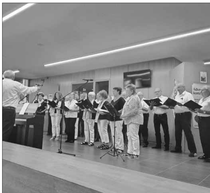
Der Gesamtchor des Gesangvereins Teningen.